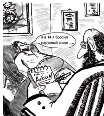
Популярная среди яхтсменов карикатура неизвестного нам автора

Уровень материальной части, технической оснащенности и комфорта помещений во всех парусных школах разный. Где-то существует дефицит лодок, где-то пока «не дотягивают» бытовые условия. Пожалуй, наилучшим образом соответствует необходимым стандартам только «Академия парусного спорта». Это, к сожалению, пока единственное в городе место, где, помимо прочих условий, есть хороший слип для спуска на воду, чтобы дети могли без дополнительных препятствий подкатить швертбот на тележке прямо к воде и спокойно отойти, не опасаясь лихачей на водных мотоциклах и не лавируя между катерами. Просторный слип «Академии» позволяет проводить там регаты с большим количеством участников. Подобных условий можно было бы добиться и в Кронштадте, благо позволяет территория и расположение местного яхт-клуба. До обострения конфликта с компанией «Центурион» там, к примеру, проводился чемпионат России в классе «49er» (2008 год). Но в связи с последними событиями без серьезных спонсоров и своевременной поддержки Санкт-Петербург может лишиться еще одного оплота парусного спорта. К сожалению, ситуация с Кронштадтским яхт-клубом для нашей страны довольно типична — слишком уж «сладкой» является прибрежная зона. Попытки захвата земель, где исторически располагаются яхт-клубы, происходят постоянно. За примерами не надо ходить далеко — в последние годы в Санкт-Петербурге был закрыт яхт-клуб ЛКИ, исчезли детские секции в Морском яхт-клубе и яхт-клубе ВМФ. Яхт-клуб «Балтиец» несколько