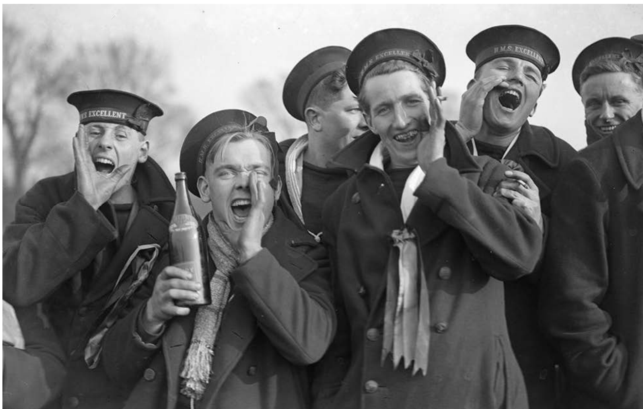
Британские моряки на футбольном матче. 1929 г.

— Интересно, что в официальных документах ни брушлат , ни буршлат замечены не были (вместо этого значилось «полупальто на урсовой подкладке») и в то же время в устной речи использовались справно .