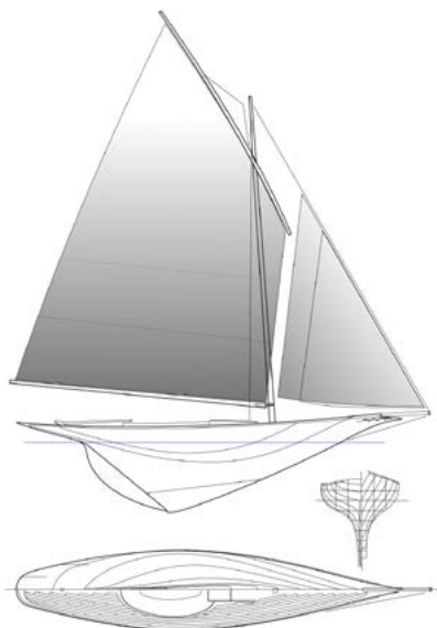
Яхта класса 30 м 2 «Roastbeef» — одно из ярких творений Кайботта