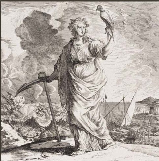
Якорь — обычная деталь на аллегорических изображениях Надежды. Середина XVII в.