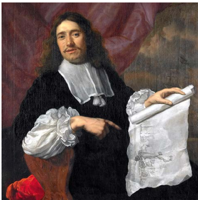
Виллем ван де Велде — младший

Слева внизу: Корабль «Золотой Лев» на рейде Амстердама