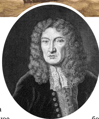
Виллем ван де Велде — старший Корабли голландского флота

До наших дней дошло большое количество рисунков того времени, изображающих военные корабли, торговые суда, рыбацкие лодки, порты, пристани, моряков. Но наиболее востребованными среди них были тогда изображения боевых действий голландского флота. Создание батальных сцен было связано для художника с большим риском: он, обычно на небольшом судне, с натуры рисовал эскизы, находясь прямо на месте сражения. Это был период англо-голландских войн, в ходе которых между этими государствами