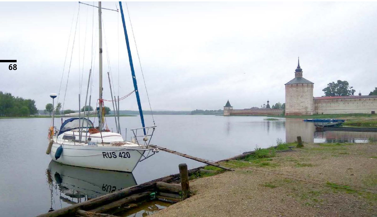
Яхта «Гея» у стен монастыря

Л етом 2017 г. во время плавания на яхте «Гея» на наши планы очень сильно повлияла погода. Выйдя в трехнедельный поход из Москвы на Онежское озеро, мы три дня простояли в ожидании улучшения погоды у Рыбинского водохранилища, а потом приняли неожиданное решение идти по старинной Северо-Двинской водной системе к городу Кириллову.