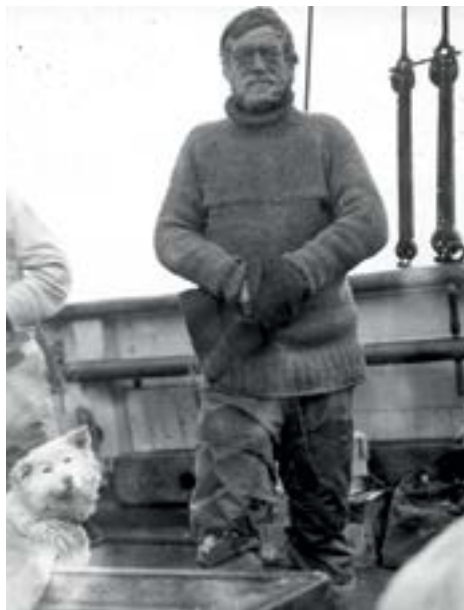
Сэр Эрнест Генри Шеклтон

«Endurance» достиг самой южной точки своего пути (76° 58' ю.ш.) 21 февраля 1915 г. Там судно сковали льды, и начался его долгий дрейф. 30 сентября корпус судна перенес тяжелейшие ледовые сжатия. Положение день от дня становилось все опаснее, и вскоре деревянный парусник стал тонуть. На лед сразу были выгружены припасы и три шлюпки. Трое суток команда пыталась спасти судно, в сильный мороз