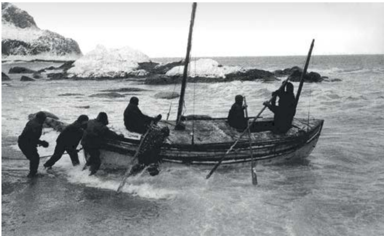
«James Caird» уходит за помощью

20 апреля 1916 г. Шеклтон официально озвучил план, который многие давно желали услышать. Как только шлюпка будет готова и в нее загрузят все необходимые для перехода припасы, он соберет команду из пяти человек, и «James Caird» отправится на Южную Георгию за помощью.