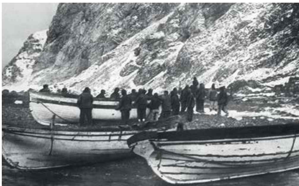
Шлюпки на берегу о. Элефант

Начинался новый день. Команды были на грани изнеможения, все ждали восхода солнца, чтобы узнать свою судьбу. В книге Лансинга этот момент описывается так: «Постепенно показалась сначала поверхность моря, а потом прямо по курсу, за туманами, высокие серо-коричневые скалы острова Элефант — менее чем в одной миле от них. Это расстояние казалось таким маленьким, как будто оставалось не более нескольких сотен ярдов. Счастью изможденных людей не было предела. И только изумление уступило место долгожданному огромному облегчению. Со скал на них внезапно обрушились мощные порывы ветра, скорость которого составляла не менее ста миль в час. Они набрасывались на поверхность моря, создавая волны чудовищной высоты <...> Это был совсем небольшой клочок суши, около ста футов в ширину и пятидесяти в длину. Скудное место на диком побережье, всецело во власти яростного субантарктического океана. Но разве это имело значение? Они были на земле! Впервые за четверта девятно семь дней они ступили на землю. Твердую, непотопляемую, непоколебимую, благословенную землю».