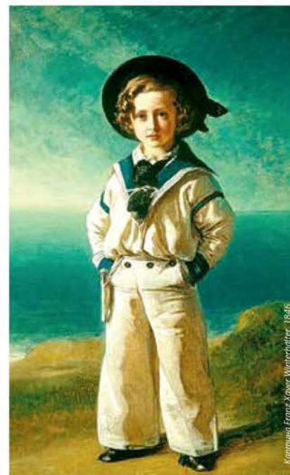
Будущий король Эдуард VII