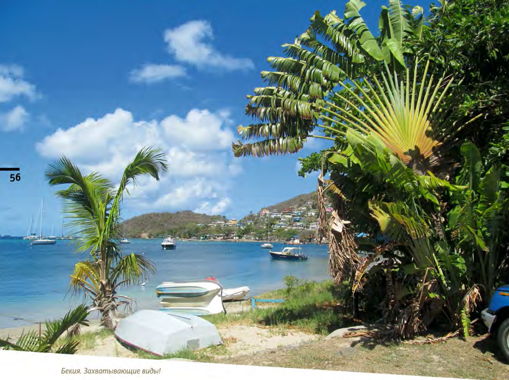
Бекия. Захватывающие виды!

Темную ночь в здешних зарослях расцветивают тропические светлячки — еще одно совершенно завораживающее зрелище.