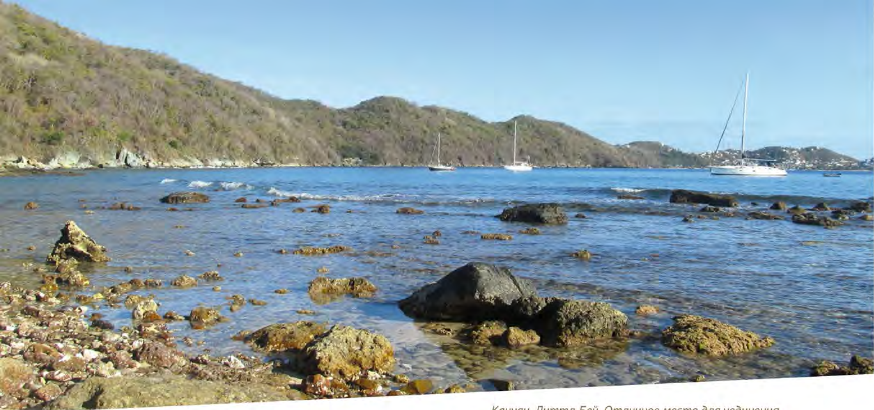
Кануан. Литтл-Бей. Отличное место для уединения

Все здешние города и столицы больше похожи на деревушки, пусть уж простят меня их жители. Клифтон очень избалован присутствием яхтсменов и туристов: товары в местных магазинах показались дороговатыми и вступали в диссонанс с внешним видом этого городка. Мне даже показалось, что нашего брата здесь дурят, специально завышая цены.