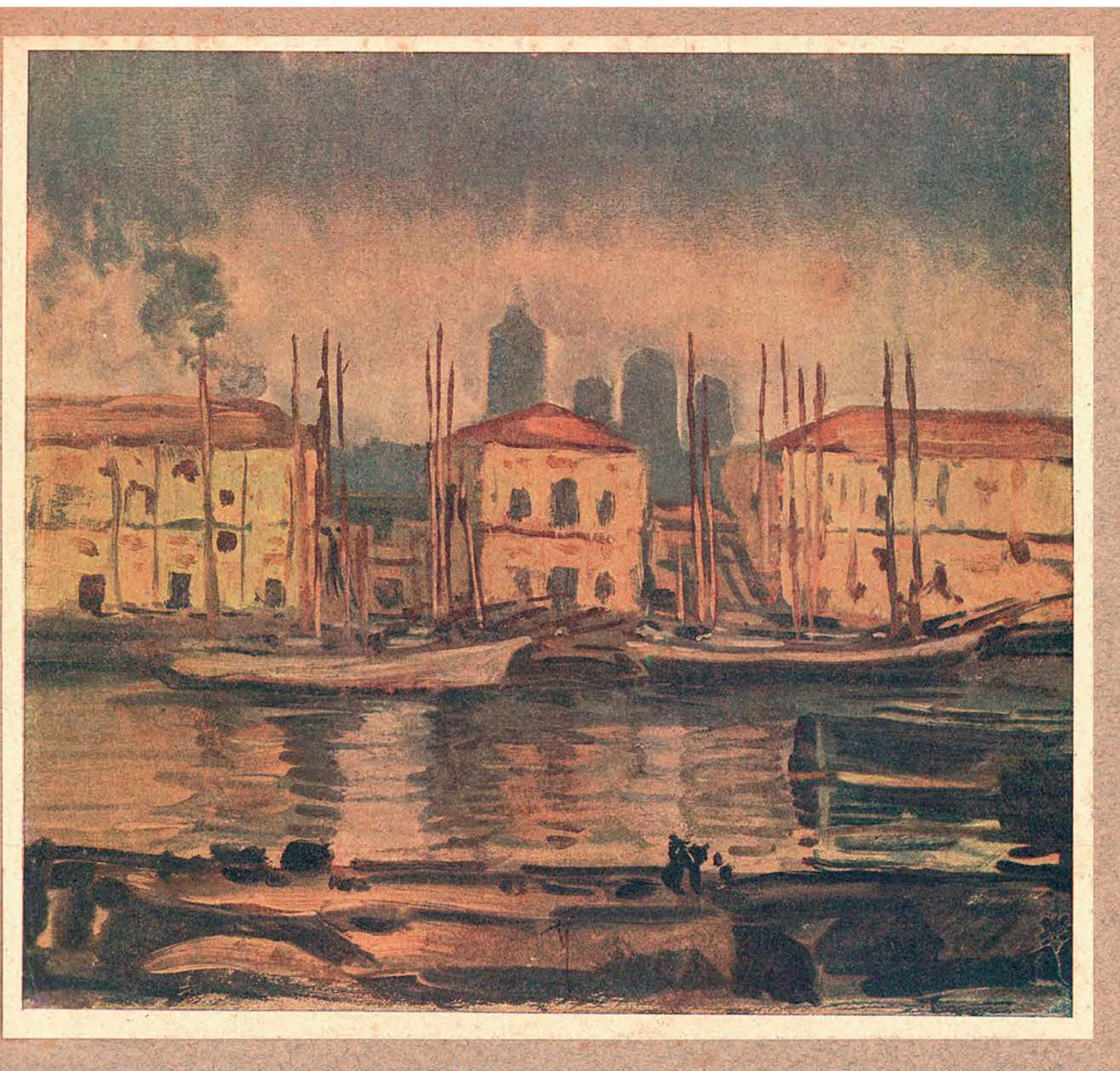
«Тучкова набережная». Художник Е. Е. Лансере. Репродукция картины начала XX в.

Остров Тучков буян возник на Малой Неве после наводнения 1726 г. Вначале он назывался просто Буян, а потом — Пеньковский буян. Тучковым он стал, когда неподалеку от него подрядчик Тучков построил мост через Малую Неву.