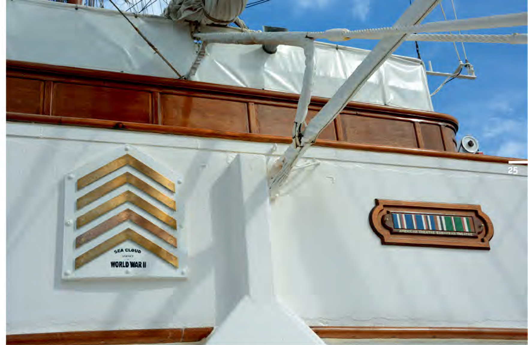
Шевроны на обвесе ходового мостика ныне напоминают об участии парусника во Второй мировой войне: по одному шеврону за каждые полгода активной службы

Однажды IX-99 оказался в очень опасной ситуации, когда ночью в штормовой Северной Атлантике впереди по курсу радаром был обнаружен объект, не желавший отвечать на позывные. Предполагая, что перед ним