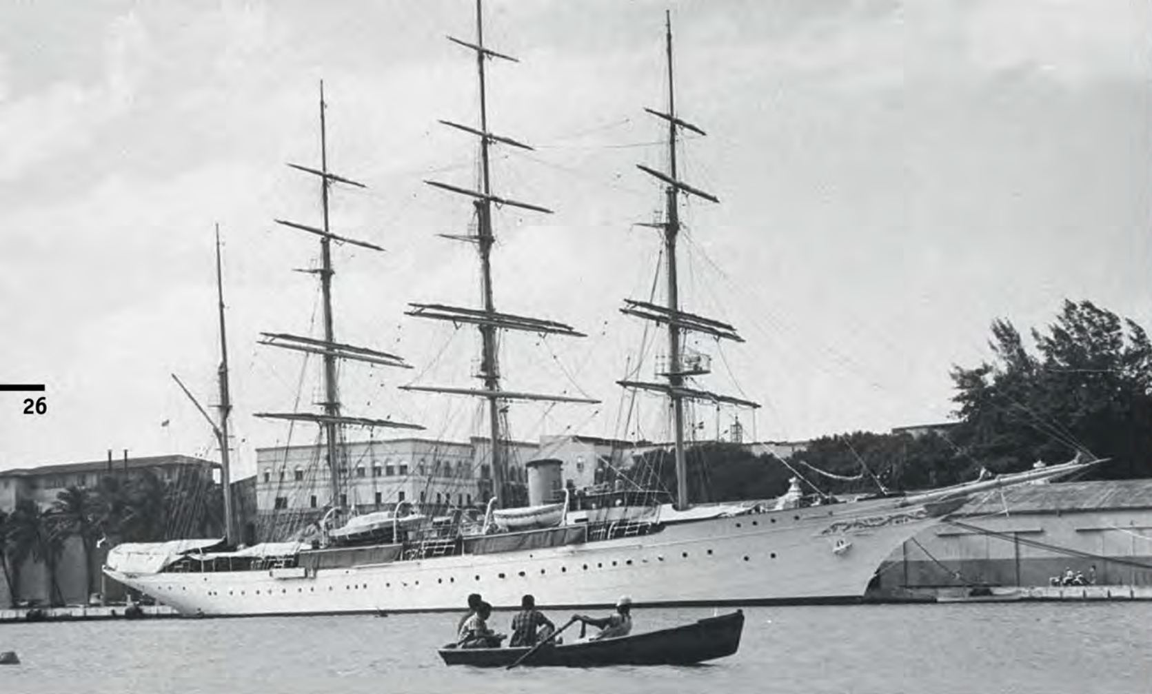
«Angelita» в 1959 г. В этом году яхта прошла в США ремонт с заменой двигателей: старая дизель-электрическая установка уступила место четырем новым 8-цилиндровым дизелям Enterprise

31 мая 1961 г. Рафаэль Трухильо был убит в результате заговора. Немедленно вернувшийся из Европы Рамфис тут же занял место отца-тирана. Он разыскал заговорщиков и подверг их нечеловеческим пыткам. Попутно за полгода пребывания у власти Трухильо-младший перевел на свои счета в европейских банках большую часть наличности республики — примерно полмиллиарда долларов.