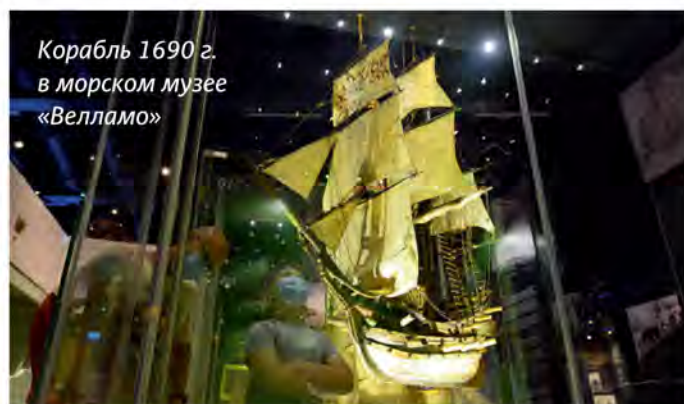
Корабль 1690 г. в морском музее «Велламо»

В пяти минутах ходьбы от яхтенной марины находится Морской центр «Велламо», где можно познакомиться с еще одним интересным образцом votiivilaiva . Это корабль из церкви Хаухо 1609 г. Судя по надписи на парусе, в 1730 г. были заменены такелаж, паруса и сделан ремонт. Трехмачтовый корабль украшает небольшая женская фигура с гербом в руке, а его экипаж составляют деревянные куклы. Судно вооружено 22 пушками. Корабль