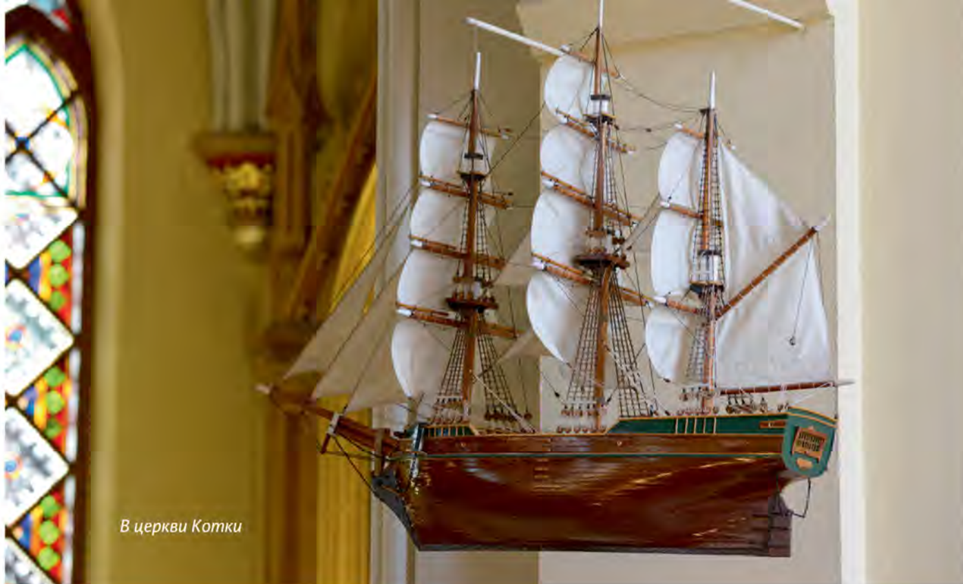
В церкви Котки