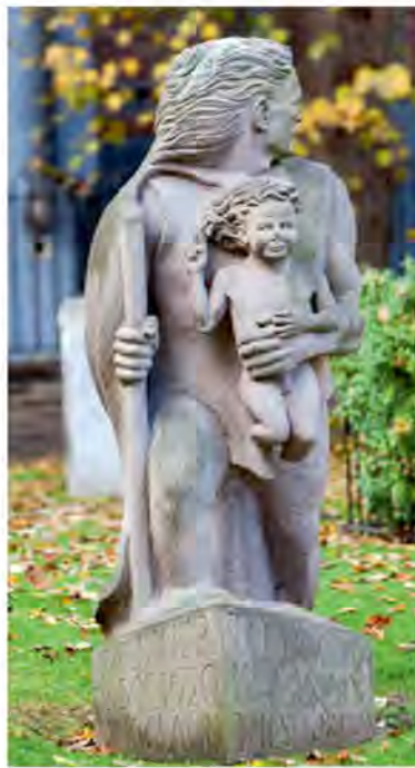
Памятник Кристоферу Колумбу. Он восстает из пучины морской, оглядываясь на «Мэйфлауэр», а ребенок с приветственным жестом — аллегория переселенцев, начинающих новую историю Америки

детей; налажили связи с индейцами, у которых скупали меха для продажи в Европу; принимали новых европейских поселенцев. «Плимутская колония» стала одним из первых поселений европейцев на территории Америки. Примечательно, что, еще не сходя на берег, пассажиры «Мэйфлауэра», будущие колонисты, определили в своем обществе принципы равноправия и равного вклада в общее благосостояние, подписав Мэйфлауэрское соглашение (Mayflower Compact), ставшее первым документом, регулирующим управление колонией.