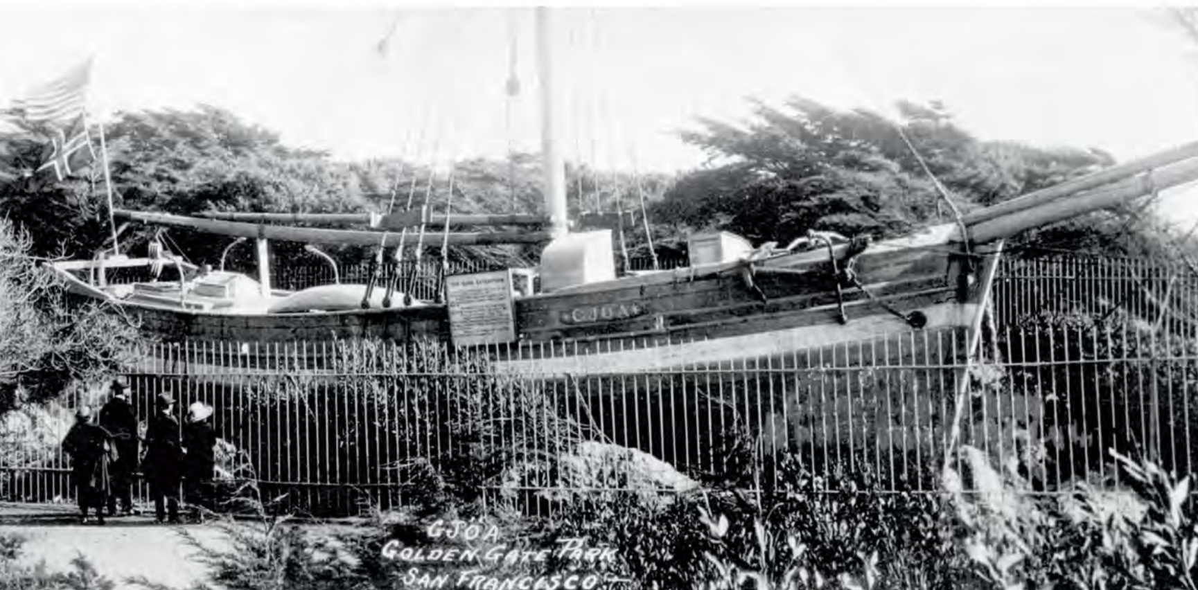
Яхта «Йоа», выставленная в Голден-Гейт, Сан-Франциско

Только 1 июля 1906 г. «Йоа» смогла сняться с якоря. 30 августа при сильном шторме был пройден м. Барроу, а значит и весь Северо-Западный проход. «Йоа» стала