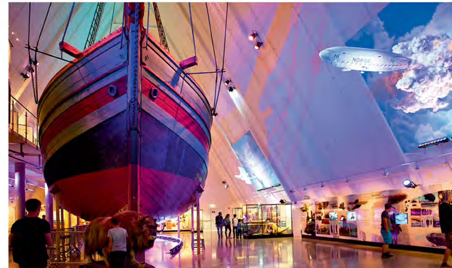
Современная экспозиция музея

Сегодня обновленную яхту можно увидеть там же, на Бюгдое, где она стоит вместе с несколькими известными судами, плавания которых прославили эту северную страну. «Йоа» по праву соседствует с «Фрамом» Нансена, репликой плота «Кон-Тики» Тура Хейердала и древним драккаром викингов.