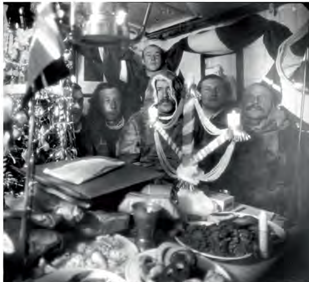
Экипаж празднует Рождество во время первой зимовки в 1903г.