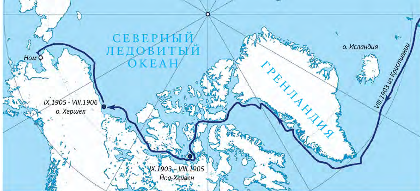
Маршрут плавания яхты «Йоа» по Северо-Западному проходу

С юности Амундсен вел спартанский образ жизни: строгая диета, физические упражнения, сон на открытом воздухе даже зимой, регулярные лыжные походы. В 1894 г. он нанялся на промысловое судно «Моргенен», чтобы освоить навигационную науку. После еще одного плавания в 1895 г. Руаль успешно сдал экзамен на штурмана и уже в этом качестве вновь ушел в море, став участником бельгийской антарктической экспедиции.