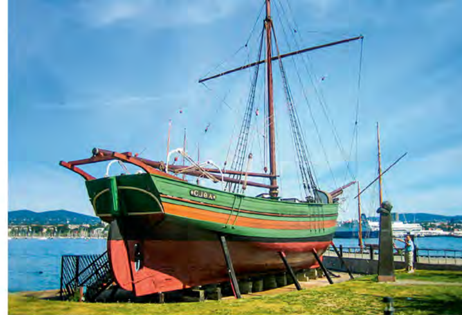
«Йоа» на п-ве Бюгдой в Осло, 70-е гг.

прекратились. После войны норвежское правительство выделило средства на реставрацию судна, и капитальный ремонт закончился в 1949 г.