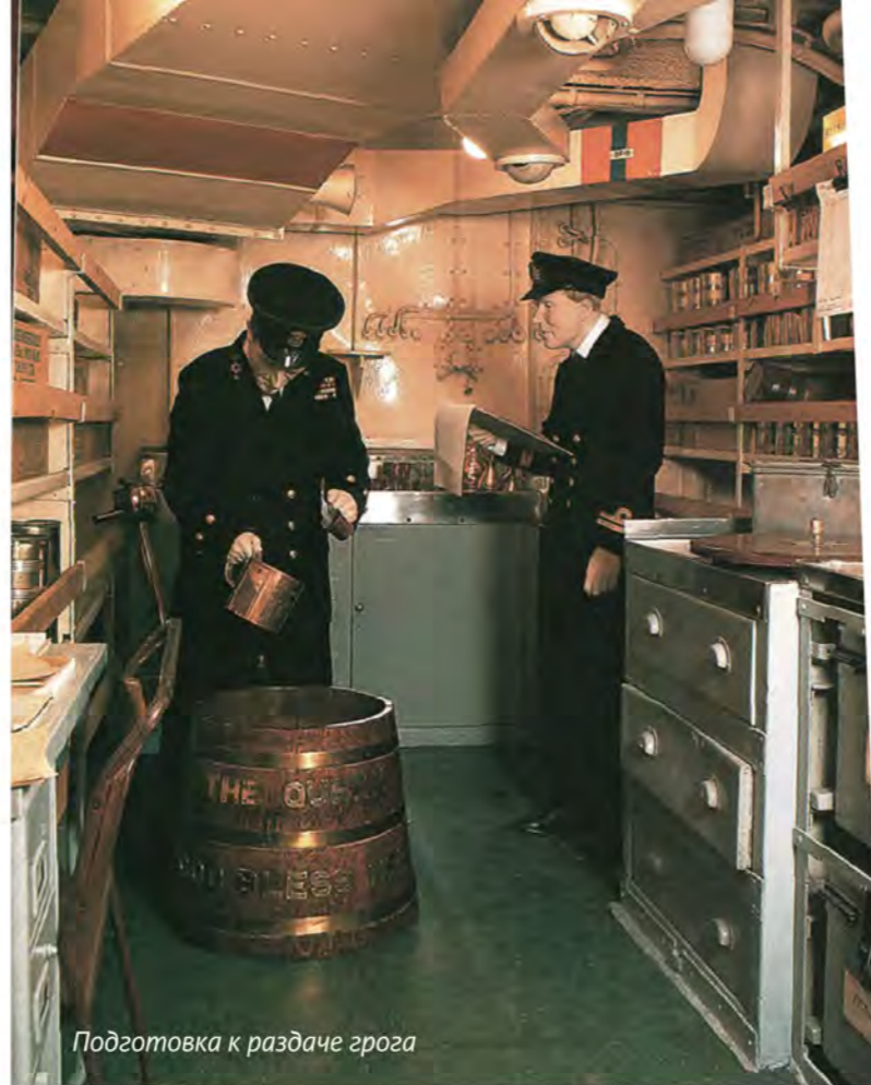
Подготовка к раздаче грога