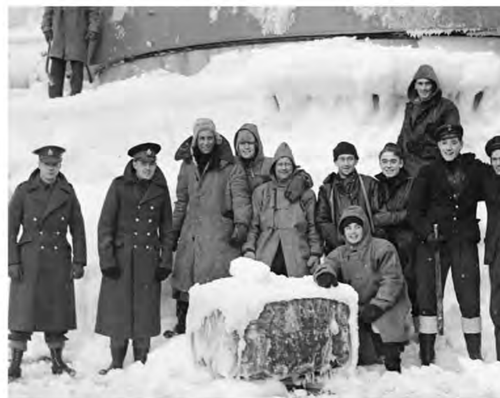
Моряки с «Белфаста» позируют перед камерой во время очистки верхних палуб корабля. Помимо помех работе оружия и систем управления, лед мог вызвать заметную потерю остойчивости, особенно опасную в тяжелую погоду. В наше время такие снимки обычно снабжают подписями «Расскажи им, как тебе трудно по утрам убирать снег с машины»

Когда в ноябре 1942 г. «Белфаст» вернулся в строй, это был уже немного другой корабль. В районе мидель-шпангоута были установлены були, которые при росте водоизмещения до 11 500 т значительно увеличили остойчивость крейсера и его противоторпедную защиту; он также получил самый современный радиолокатор и систему управления артиллерийским огнем. И очень скоро все это очень пригодилось, поскольку «Белфаст» стал флагманом 10-й крейсерской эскадры, осуществляющей прикрытие арктических конвоев, которыми отправлялись грузы в северные порты Советского Союза. Одним из самых запоминающихся для экипажа был конвой JW53 из Исландии в Мурманск в конце февраля 1943 г. Хотя немцам не удалось нанести конвою значительные потери, разыгравшийся ураган повредил как грузовые суда, так и сопровождавшие их военные корабли. Практически весь 1943 г. «Белфаст» провел в ледяных водах Арктики.