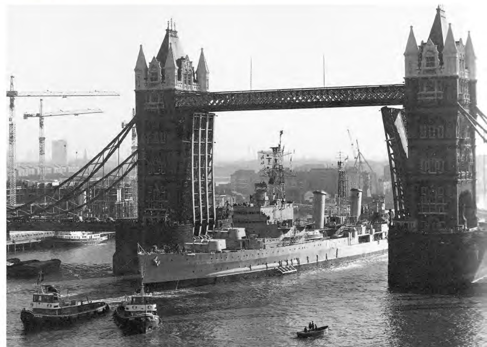
На пути к месту стоянки выше Тауэрского моста. 15 октября 1971 г.

В 1950 г. началась Корейская война, которая также не обошлась без «Белфаста». Он стал одним из первых британских кораблей, принявших участие в этом конфликте в составе сил ООН. Его служба длилась 404 дня, в течение которых он постоянно патрулировал и огнем своих орудий поддерживал наземные операции. В последний раз крейсер участвовал в обстреле 27 сентября 1952 г.