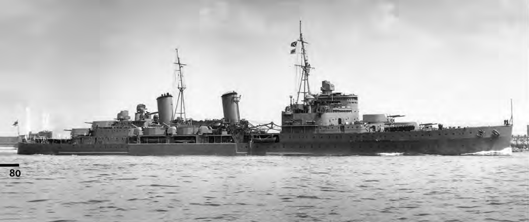
«Белфаст» перед началом войны, август 1939 г.

вооружение и количество всех типов военных кораблей. Как следствие, в Британии начали развиваться два типа крейсеров: «тяжелые крейсера» водоизмещением около 10 000 т, вооруженные 8-дюймовой артиллерией и способные к решению самых различных задач; и меньшего размера, «легкие крейсера», с 6-дюймовой артиллерией главного калибра и более узкой задачей поддержки линейных кораблей.