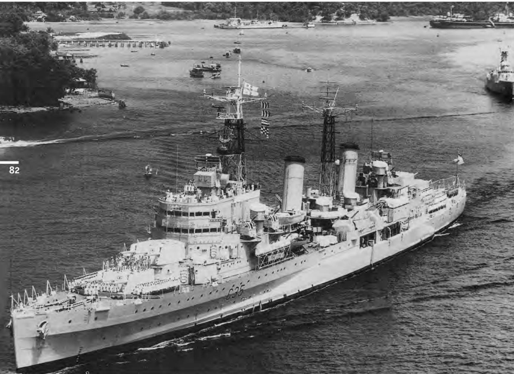
«Белфаст» в последний раз покидает Сингапур. Апрель 1962 г.