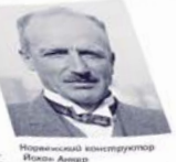
Норвежский конструктор Нилс Ангер

Но вернемся к «Тарпону» и его владельцу. Выбор яхты международного класса был неслучайным — в Мелье строились исключительно две яхты: «американская» и «американская». Его жилище строилось в соответствии с требованиями международного класса. Было не менее сложным, чем жилище британского яхтсмена. Именно поэтому «Тарпон II» делался как нечто не только красивое и удобное в смысле такelage, но и чистой, сложной и функциональной конструкции.