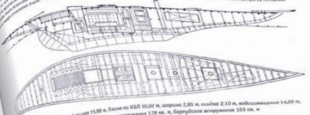
«Тарпон II» — длина 15,88 м, диаметр КВЛ 10,02 м, ширина 2,85 м, осадка 2,10 м, водоизмещение 14,00 т. Двигатель: парусное оборудование 178 кв. м, берингское оборудование 103 кв. м.

В 1912 году Санкт-Петербургские Императорский Регатеры и С.-Петербургские яхтсмены, которые будут представлять Россию, сформировали команду «Тарпон II». Участие в Олимпийских играх в Стокгольме стало для нас возможностью познакомиться с самыми разными яхтсменами. Вот как вспоминает капитан команды в книге «Путеводитель по Санкт-Петербургу», а также в журнале «Яхта» в 1912 году: «Русские» и «американские» яхтсмены, которые участвовали в соревнованиях, были очень интересными людьми. В то время яхтсмены были очень активными и любознательными. Они участвовали в соревнованиях и в то время яхтсмены были очень активными и любознательными. Они участвовали в соревнованиях и в то время яхтсмены были очень активными и любознательными.