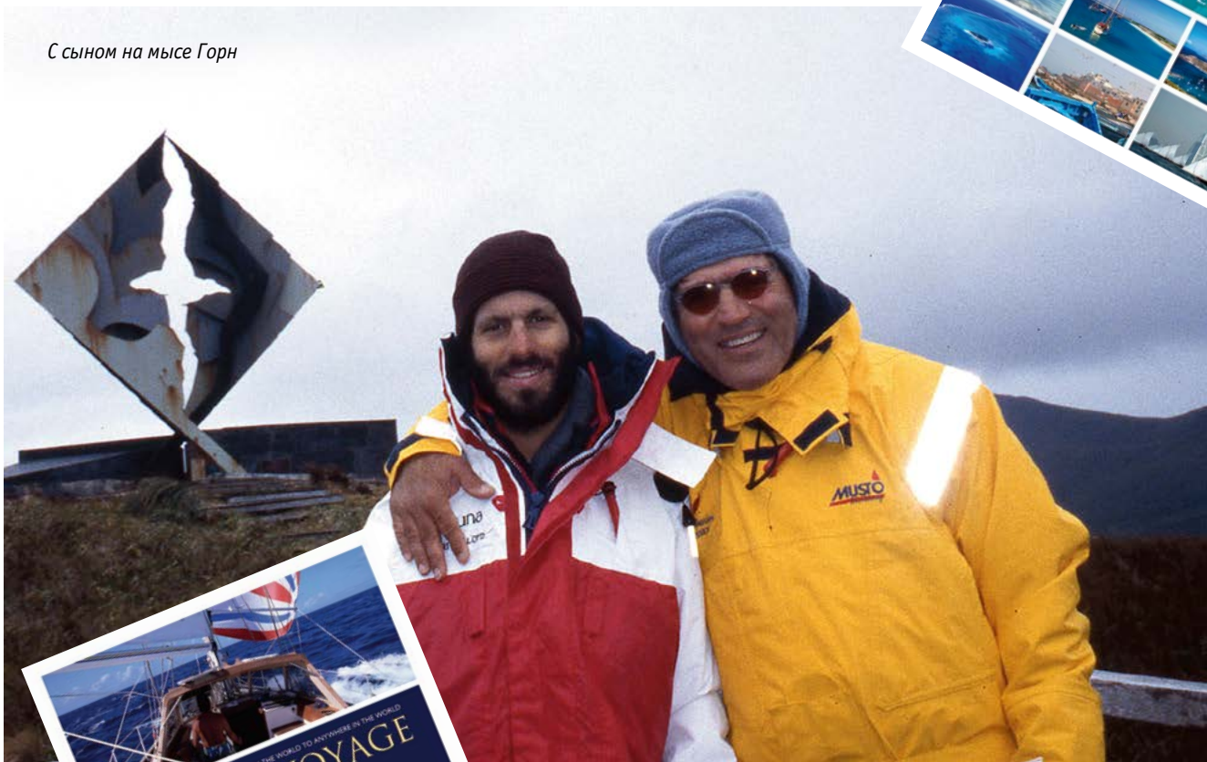
С сыном на мысе Горн