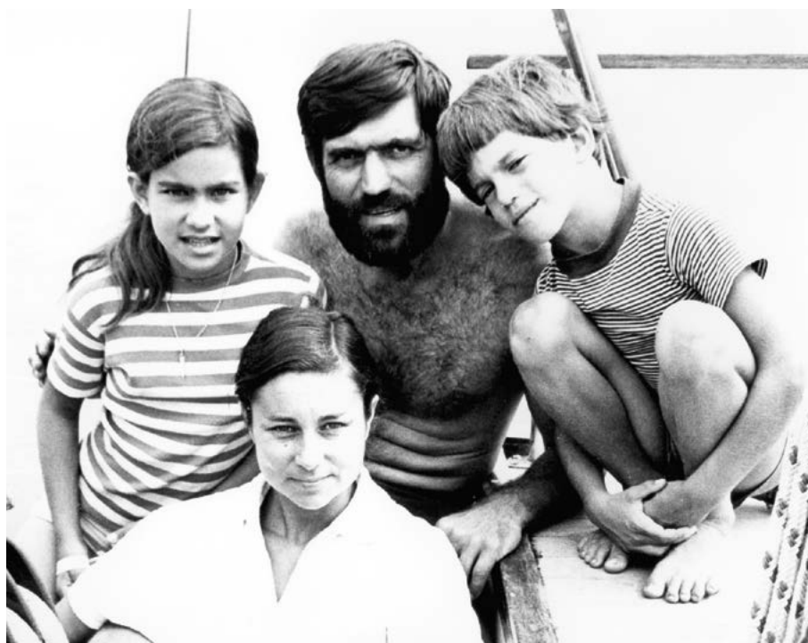
Корнелл в плавании со своей женой и двумя маленькими детьми

В 1998 году Корнелл стал владельцем новой, уже треть-