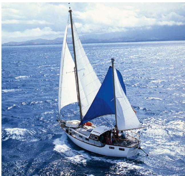
Первая яхта Корнелла — «Aventura»

2006 году. На сегодняшний день Джимми Корнелл прошел 200 000 миль по всем океанам мира, совершив три кругосветных плавания и два похода в Антарктику.