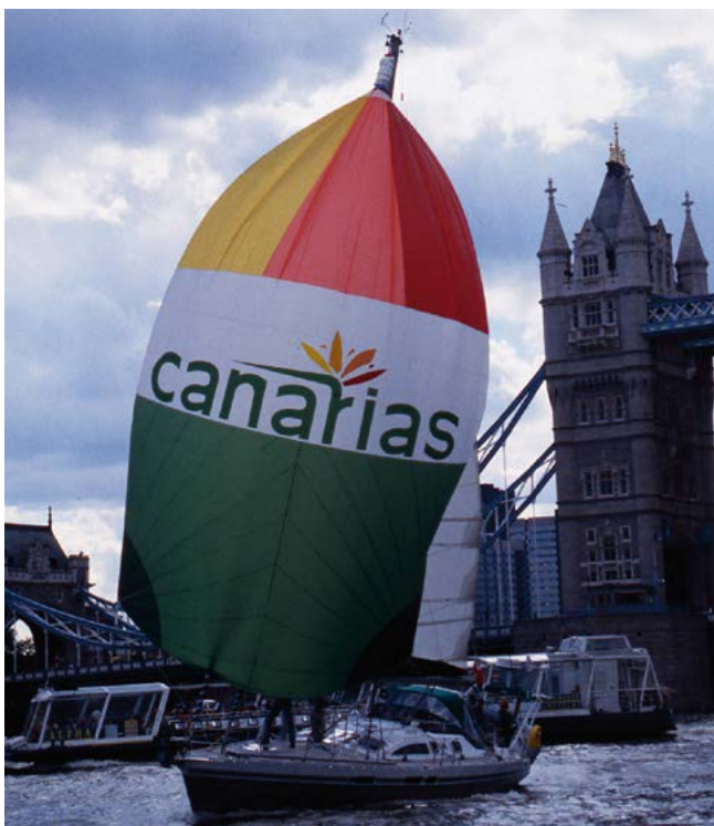
«Aventura III» много ходила в высоких широтах

В 2010 году Джимми опубликовал книгу «World Cruising Destinations», которая включила практическую информацию по 184 странам, имеющим выход к морю. Книга «Cornell's Ocean Atlas», вышедшая в 2011 году, представляет собой подборку карт Мирового океана на основе последних спутниковых исследований, дающих исчерпывающую картину погодных условий во всех океанах мира.