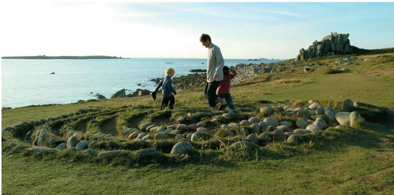
Лабиринт на западном берегу острова Сент-Агнес

Ярким примером коварности этого места стала катастрофа, которая произошла в октябре 1707 года, когда средиземноморская эскадра английского флота возвращалась на родину. Ее вел адмирал сэр Клоудезли Шовел, уже предвкусивший приход кораблей в Портсмут, где его ждал триумф и награды за блестяще проведенную кампанию. Но флагманский корабль — 96-пушечный «Ассошиэйшн», повернув ночью на восток для входа в Ла-Манш, вылетел на риф Гилстон, расположенный между островами Самсон и Сент-Мэрис. Вслед за ним на скалах оказались шедшие в кильватере линейные корабли «Игл», «Ромни» и фрегат «Феникс». Чуть позже в ловушку попал брандер «Файербранд». Все они были разбиты и опрокинуты. В ту ужасную ночь королевский флот потерял пять кораблей и 2500 военных моряков. Остальные суда поредевшей эскадры сумели отвернуть в открытый океан, где и дождались рассвета для уточнения своего местоположения.