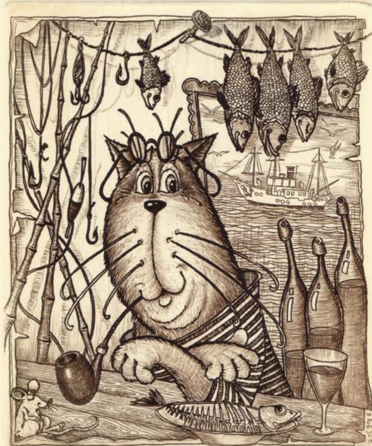
операция «КОТ БАЧА» В. Розин