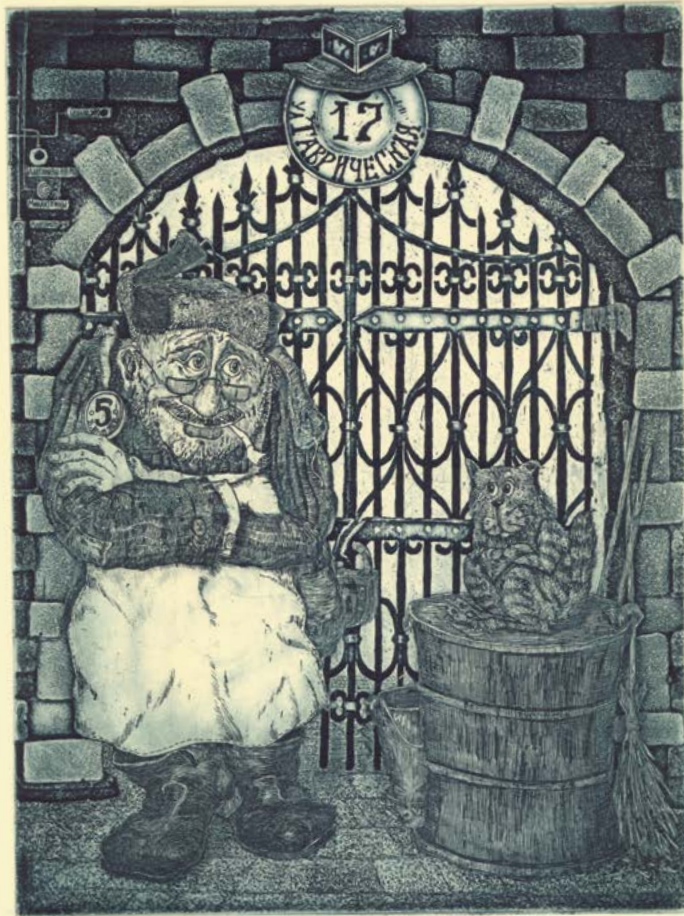
Э. Козлов «КАМЕРЧЕВАЯ»