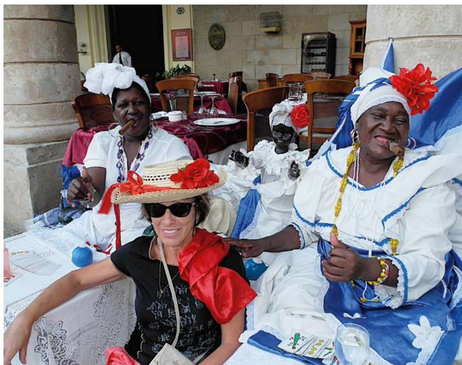
Туристам легко можно найти модели для фотографии на память

В стране, строящей «новое общество», основными объектами производства и национальной гордостью являются алкоголь и табак. Это официальная часть гордости. Возможно, это и есть оружие, при помощи которого новому миру удастся победить мир потребления. Туристы разнесут алкоголь-никотиновую заразу по всему свету, и планета в короткое время очистится от неумеренных потребителей.