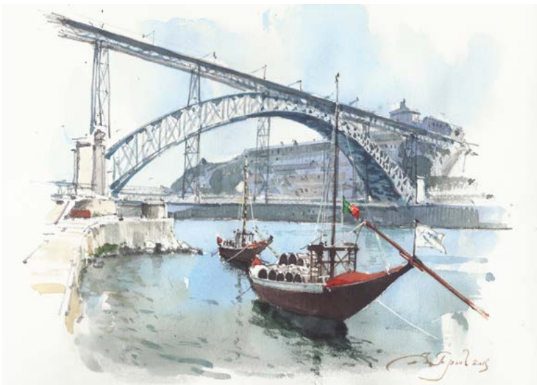
Рисунок Андрея Трона

освоения новых земель. Его еще называют морским или канатным — за обилие виртуозной резьбы в виде канатов и скрещенных снастей. А главным символом стиля стала армиллярная сфера — астрономический прибор, который использовали мореплаватели. Ее изображение до сих пор красуется на гербе Португалии.