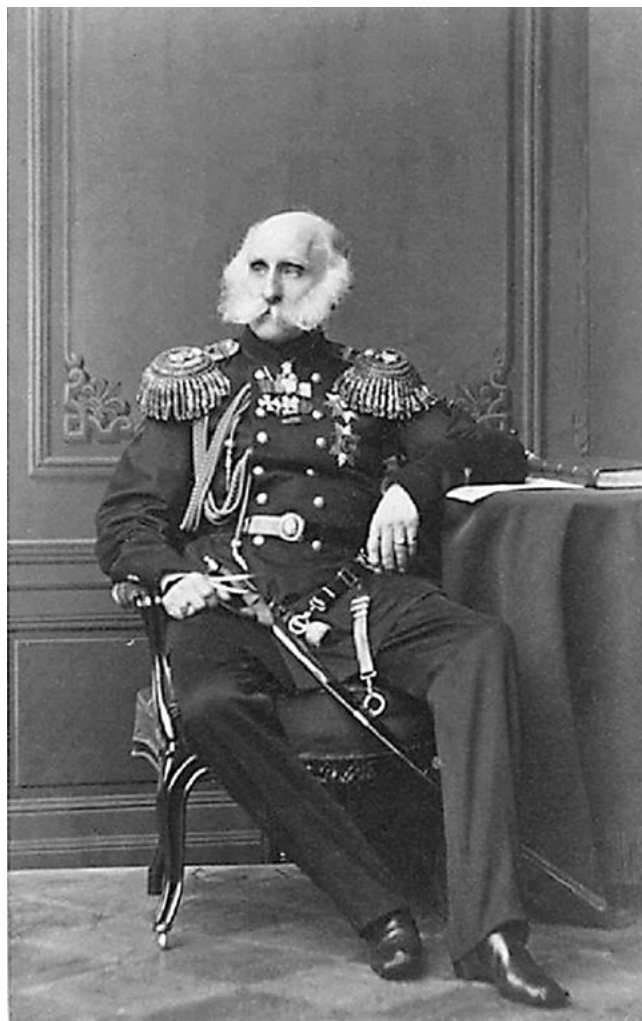
Граф Федор Петрович Литке, адмирал, мореплаватель и географ, исследователь Арктики

Будущий министр внутренних дел П. А. Валуев писал: «Могло ли бы все это быть сделано, если бы судьбами Морского министерства ныне не правила твердая рука генерал-адмирала, носящего титул императорского высочества?».