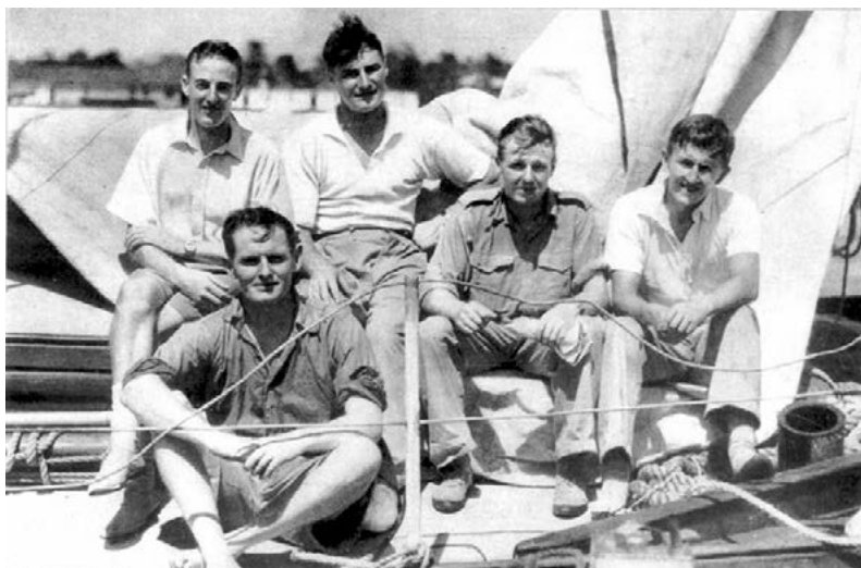
Экипаж яхты «Tai-Mo-Shan», 1933 г.

Пятеро молодых морских офицеров, чья служба в этой части света подходила к концу, решили избрать для возвращения домой не совсем обычный путь. Молодость жаждала приключений (лишь одному из них к тому