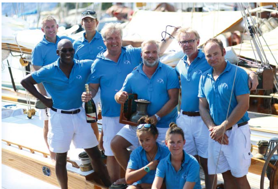
Экипаж яхты «Skylark» с долгожданным трофеем «Dorade» Trophy