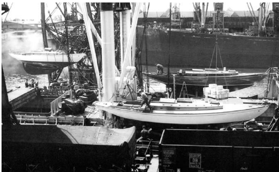
Погрузка яхт на судно для отправки в США

Спущенная на воду яхта, получившая при крещении имя «Java», сразу привлекла внимание яхтсменов. Изящная, со стройными обводами, высоким рангоутом и узкой, плавно выходящей из воды кормой, она лишней раз подтверждала: там, где есть красота, есть и скорость. Яхта действительно оказалась быстроходной. Компания в короткий срок получила заказ на строительство еще двух таких лодок. До начала Второй мировой войны на воду были спущены четыре Concordia yawl.