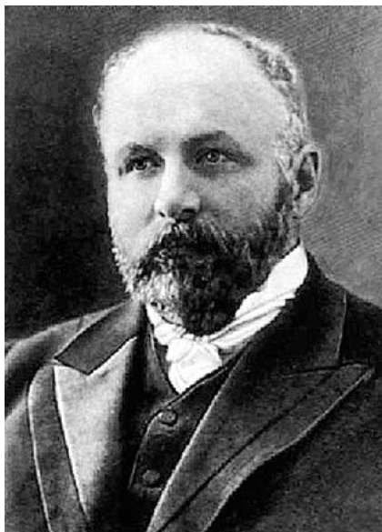
Александр Петрович Фан-дер-Флит

«Фофан» до 70-х гг. XX в. был главной лодкой на всех прокатных лодочных станциях страны