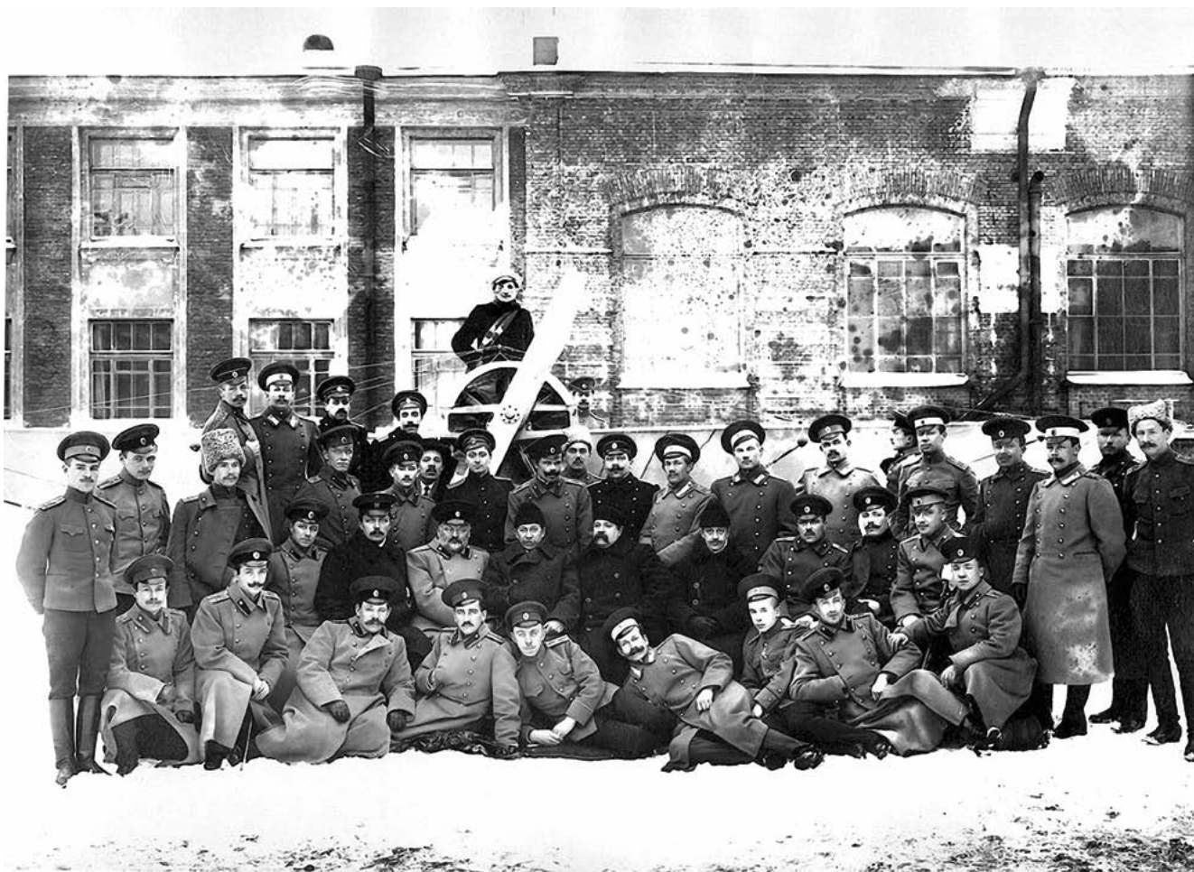
Санкт-Петербургский Политехнический институт. Выпуск офицерских авиационных курсов. 1913 г.

гда авиации. С 1909 г. Александр Петрович начал читать курс аэродинамики на воздухоплавательных курсах, организованных при Кораблестроительном отделении Политехнического института. Это была первая в России авиационная школа с оборудованными по последнему слову техники аэродинамической и аэрологической лабораториями, мастерской, музеем, библиотекой. Через два года Фан-дер-Флит опубликовал обширный курс аэромеханики, охватывавший широкий круг вопросов и явившийся первым русским руководством такого рода. Вплоть до 1917 г. Политехнический институт готовил кадры для авиационной промышленности и военной авиации. А. П. Фан-дер-Флит курировал всю сеть учебных заведений авиационного профиля и преподавал в некоторых из них.