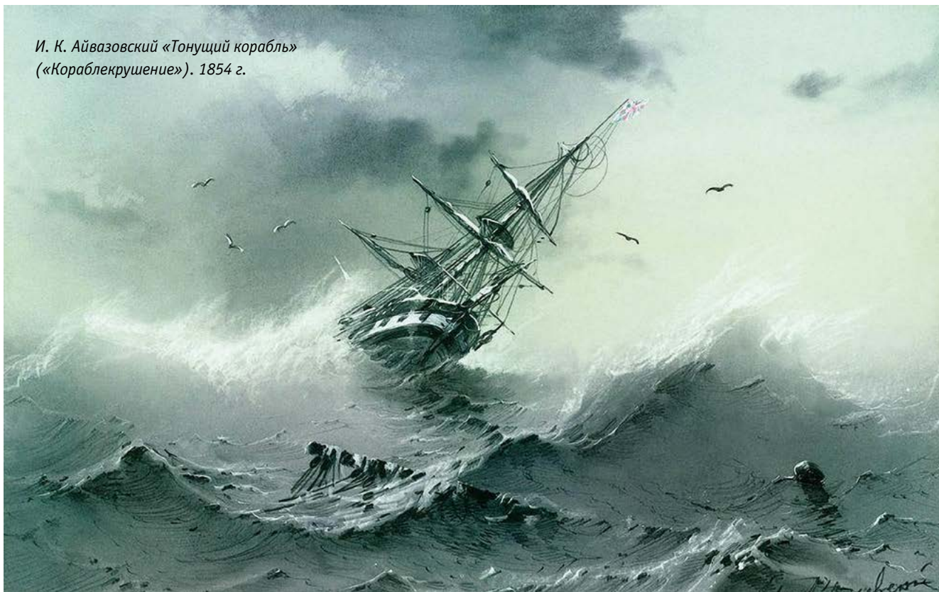
И. К. Айвазовский «Тонущий корабль» («Кораблекрушение»). 1854 г.

«Моряки, в силу своей деятельности подвергающиеся опасностям во всех морях, не помнят, чтобы им приходилось быть свидетелями подобной бури, — писал командир одного из уцелевших британских кораблей. — Представьте