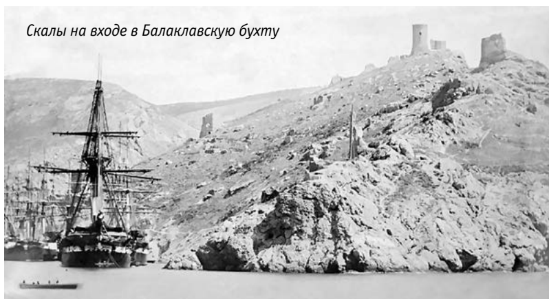
Скалы на входе в Балаклавскую бухту

Французам и англичанам было некуда деваться от непогоды. Окопы превратились в каналы, лагерь — в болото, палатки унесло ветром и изорвало, дороги развезло, подвоз боеприпасов и продуктов прекратился. В довершение всего ударили морозы, и все вокруг замело снегом. По морю плавали обломки кораблей, стога сена, трупы людей