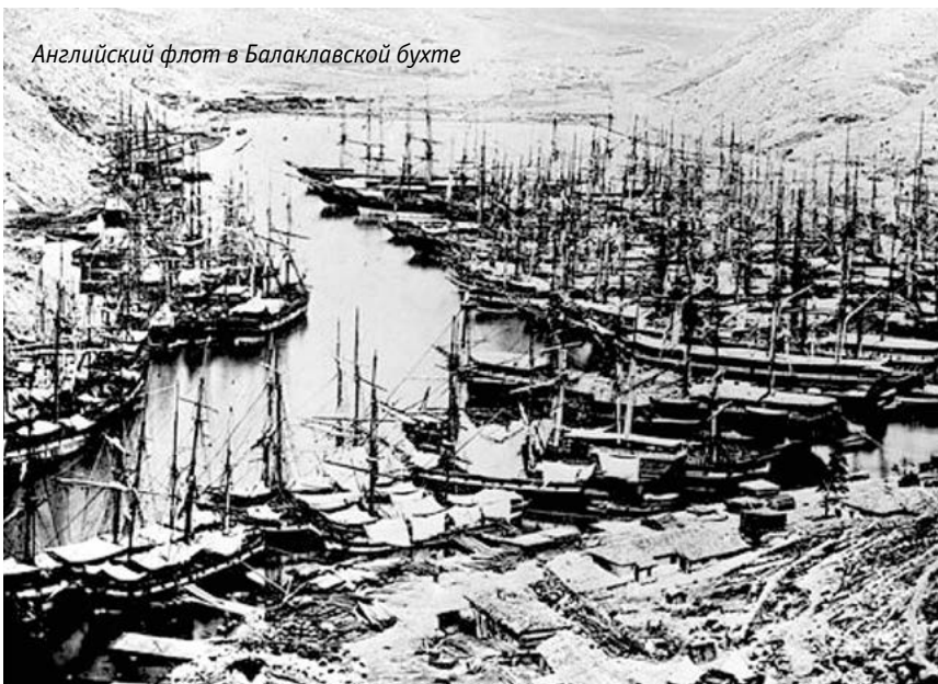
Английский флот в Балаклавской бухте

не могли обходиться. По понятным причинам базы должны были располагаться как можно ближе к осажденному Севастополю, но укрытых мест, которые можно было приспособить для этого, было мало. Англичане, пользуясь тем, что первыми оказались в Балаклавской бухте, ввели туда свои корабли и обустроились там, предложив французам подыскать себе другое место. Те выбрали для базирования Камышовую бухту.