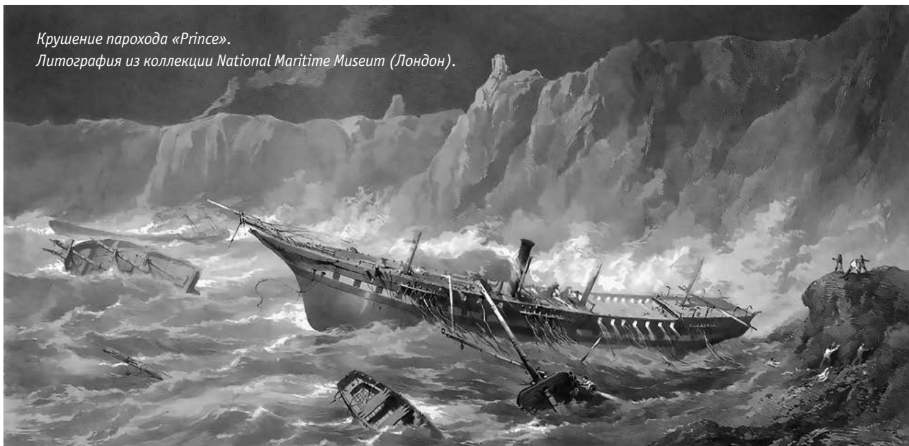
Крушение парохода «Phips». Литография из коллекции National Maritime Museum (Лондон).

и лошадей, ящики и амуниция. Солдаты неприятельской армии начали болеть и умирать от цинги, простуд и обморожений, а среди турецких солдат и вовсе началась эпидемия холеры.