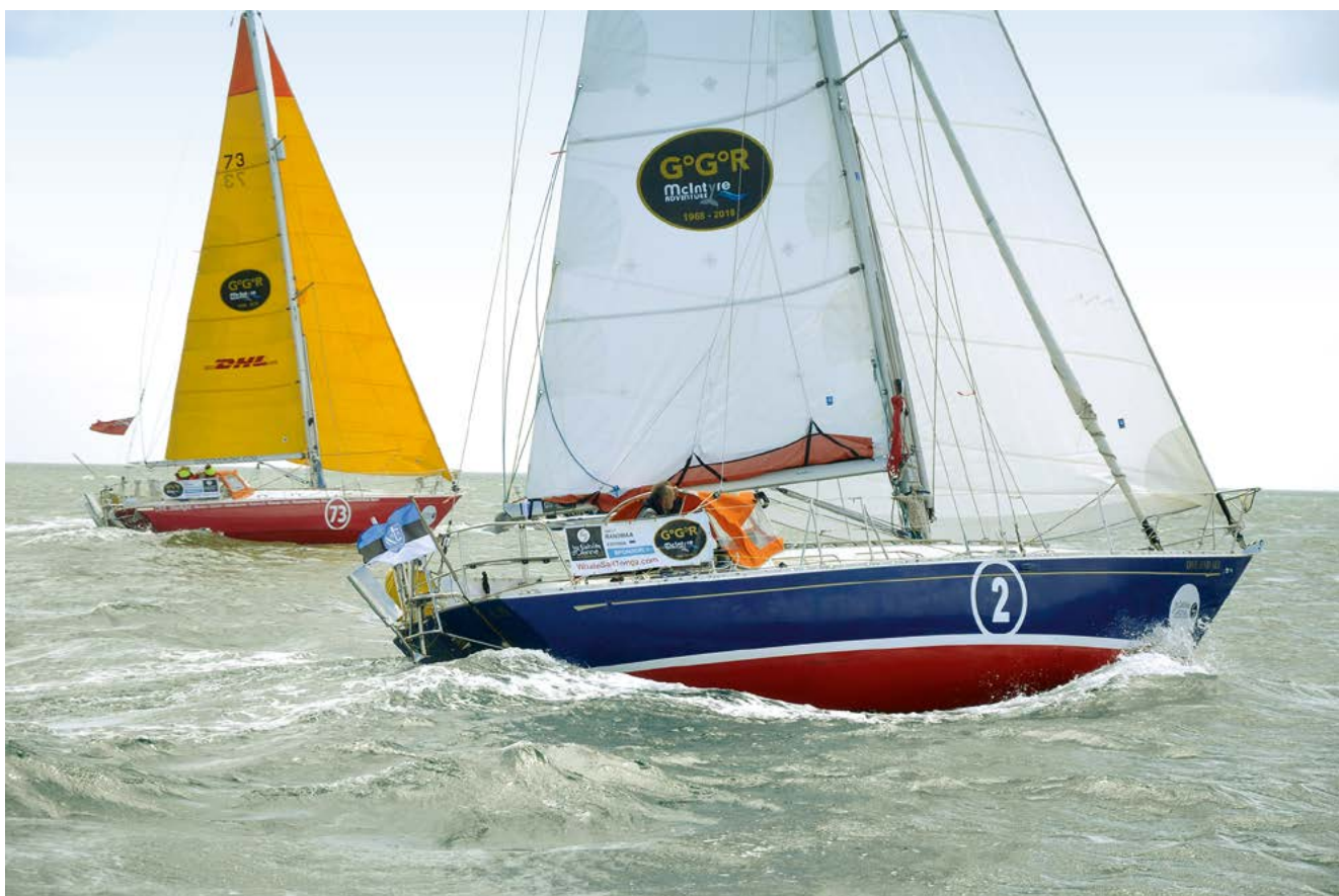
Фотография GGR 2018