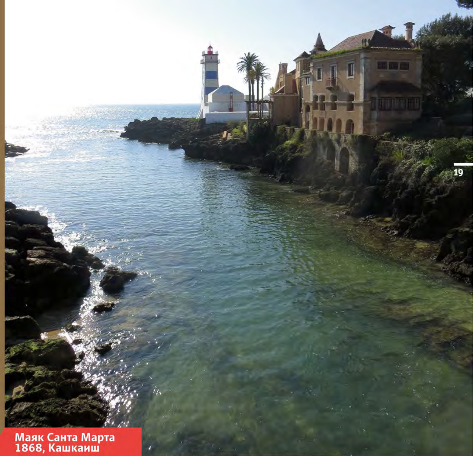
Маяк Santa Marta 1868, Кашкаиш

Кашкаиш — одно из любимых туристами мест в Португалии. И там же находится один из самых узнаваемых в мире маяков — Santa Marta. Известен он благодаря не совсем обычной раскраске: голубой цвет крайне редко используют для маячных башен, так как он сливается с морем и небом, а маяк должен быть максимально заметен на фоне окружающей среды. Для меня так и осталось загадкой, почему Santa Marta так окрашен, но нельзя не согласиться: красив! Все маяки красивы, но этот так и просится на открытку со своими пальмами, мостиком и россыпью острых камней у подножия. Вероятно, маяк вызывал такой сильный интерес у туристов, что пришлось открыть его для посещений. У подножия башни появился небольшой музей из двух комнат и прочие блага цивилизации: кафе, билетная касса, сувенирная лавочка. Почтенные португалки-смотрительницы строго следят, чтобы на башню не поднималось больше 5–6 человек за раз, и забавно свистят в свисток, если кто-то нарушает порядок.