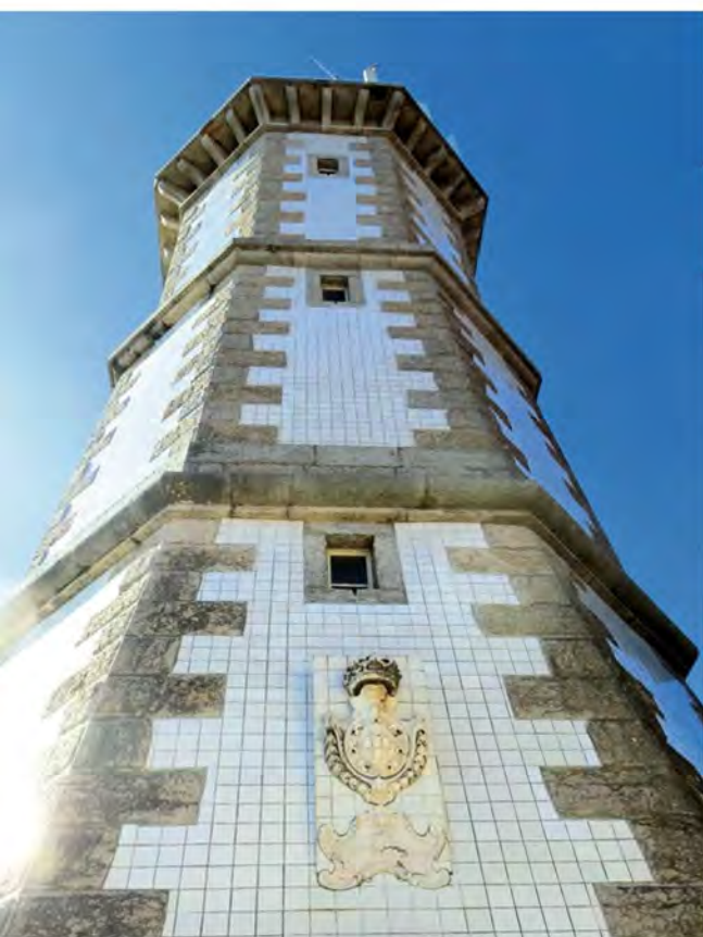
Маяк Гия 1761, м. Гия