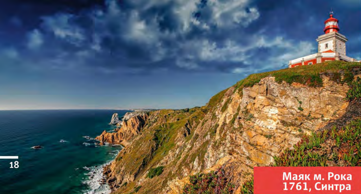
Маяк м. Рока 1761, Синтра

Место чрезвычайно популярно у романтиков всех национальностей, поскольку это самая западная точка континентальной Европы. Именно здесь «кончается земля и начинается море». И, разумеется, маяк на этом живописном обрывистом мысе по-настоящему необходим. Его построили в 1761 г. по приказу Маркиза де Помбала, который восстанавливал свою страну после сокрушительного землетрясения 1755 г. В XX в. рядом с маячным городком была фабрика по производству ацетилена высочайшего качества, который использовался для ламп не только во всей Португалии, но в других европейских странах.