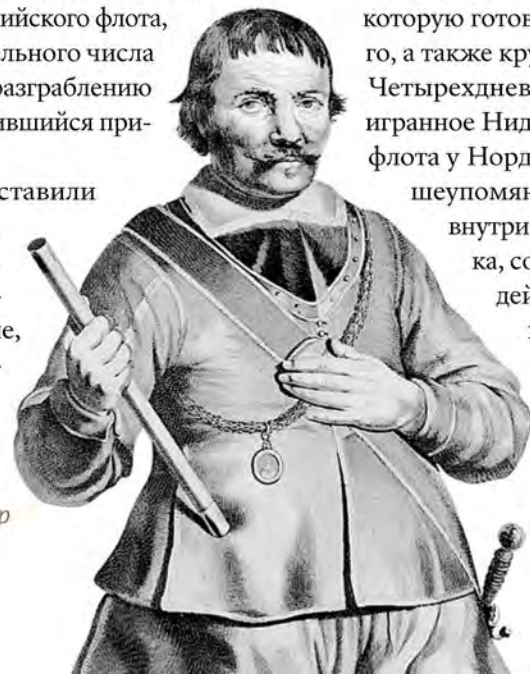
Адмирал Михаил де Рюйтер

Атаке предшествовали одна неудачная попытка, которую готовили за несколько месяцев до этого, а также крупные бои 1665–1667 гг., такие как Четырехдневное сражение (июнь 1666 г.), выигранное Нидерландами, реванш королевского флота у Норд-Фореленда (август 1666 г.) и вышеупомянутый «костер Холмса»; сложная внутри- и внешнеполитическая подготовка, согласование планов и координация действий с двуличным союзником — королем Франции Людовиком XIV, проведенные Яном де Виттом, фактическим главой Соединенных провинций.