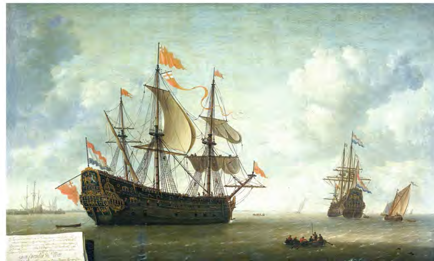
Картина Джеронимуса ван Диста (II) «Прибытие «Роял Чарльза»». Находится в Рейксмузеуме

22 июня нидерландская эскадра преодолела хаотично расставленные заграждения из затопленных кораблей и форсировала защитную цепь. Подавив огонь нескольких береговых батарей и замка Апнор, передовой отряд Республики продвинулся вверх по Медуэю к Чатему и продолжил атаковать королевский флот. Несмотря на то что адмиралы Соединенных провинций решили остановить атаку, не дойдя до Чатемских королевских верфей, урон