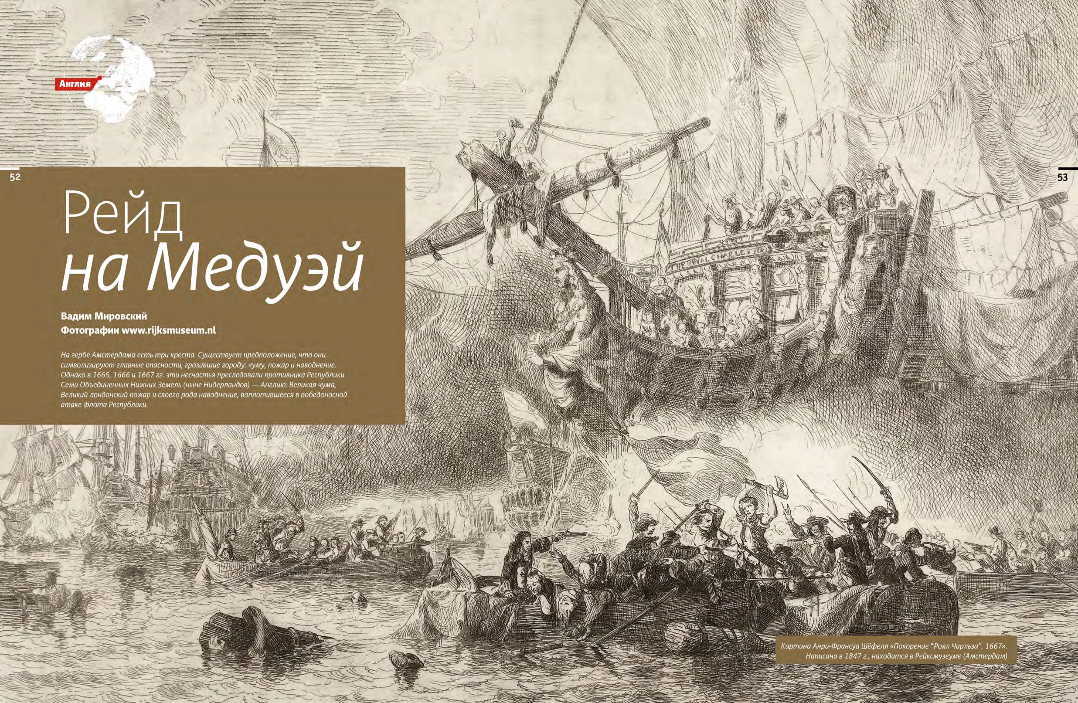
Картина Анри-Франсуа Шёфеля «Покорение «Роял Чарльза», 1667». Написана в 1847 г., находится в Рейксмузеуме (Амстердам)

На гербе Амстердама есть три креста. Существует предположение, что они символизируют главные опасности, грозившие городу: чуму, пожар и наводнение. Однако в 1665, 1666 и 1667 гг. эти несчастья преследовали противника Республики Семи Объединенных Нижних Земель (ныне Нидерландов) — Англию: Великая чума, Великий лондонский пожар и своего рода наводнение, воплотившееся в победоносной атаке флота Республики.