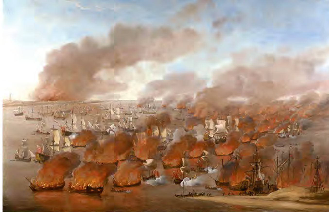
19–20 августа 1666 г. контр-адмирал Роберт Холмс провел рейд на Фрисландские о-ва. Позже это событие назвали «костром Холмса»

В 1665 г. в Англии началась эпидемия бубонной чумы, выкосившей, по некоторым оценкам, пятую часть населения столицы. В 1666 г. за эпидемией последовал пожар в Лондоне. Оба события хотя и не явились прямыми причинами, но создали предпосылки для военного разгрома, потрясшего королевство в 1667 г.