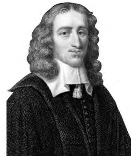
Ян де Витт

В составе республиканского флота были не только морские экипажи, но и специализированный корпус морской пехоты для ведения десантных операций (новшество для того времени). Возглавлял рейд активный участник англо-голландских войн победоносный адмирал Михаил де Рюйтер.