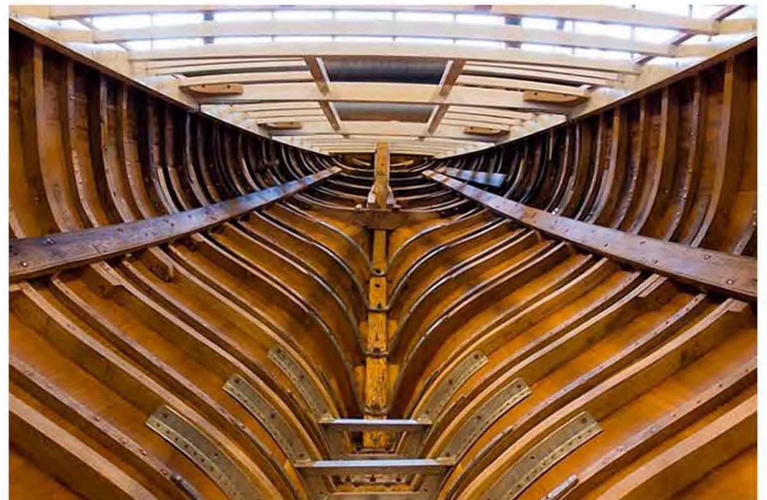
Во время ремонта во Фредрикстаде, Норвегия

В дореволюционное время яхта Нагорнова ходила под российским флагом и вымпелом Санкт-Петербургского Речного яхт-клуба.