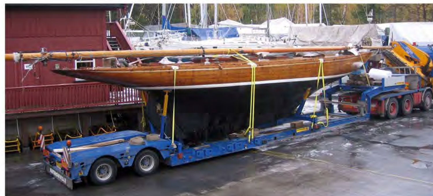
Яхта готова к спуску на воду, 2015 г.