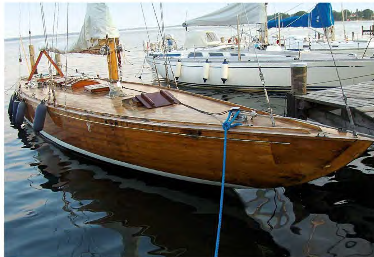
Перед капитальным ремонтом, начатым в 2014 г.

Леонид Нагорнов всегда самостоятельно вел очень подробный судовый журнал, и эти записи сохранились до наших дней. Он измерял дальность каждого плавания, и базируясь на этих данных, подсчитал, что между