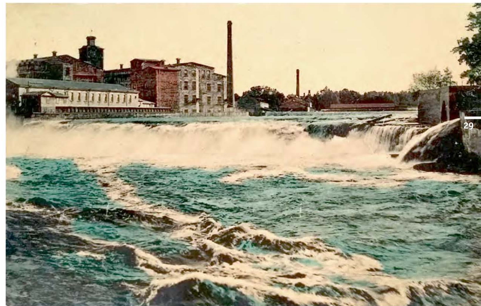
Нарвский водопад. Открытка начала XX в.

канала, подающего воду к гидротурбинам, и плотины, подпирающей водохранилище, водопад прекратил свое существование (сейчас полюбоваться им можно 2 раза в год, когда из водохранилища спускают излишки воды).