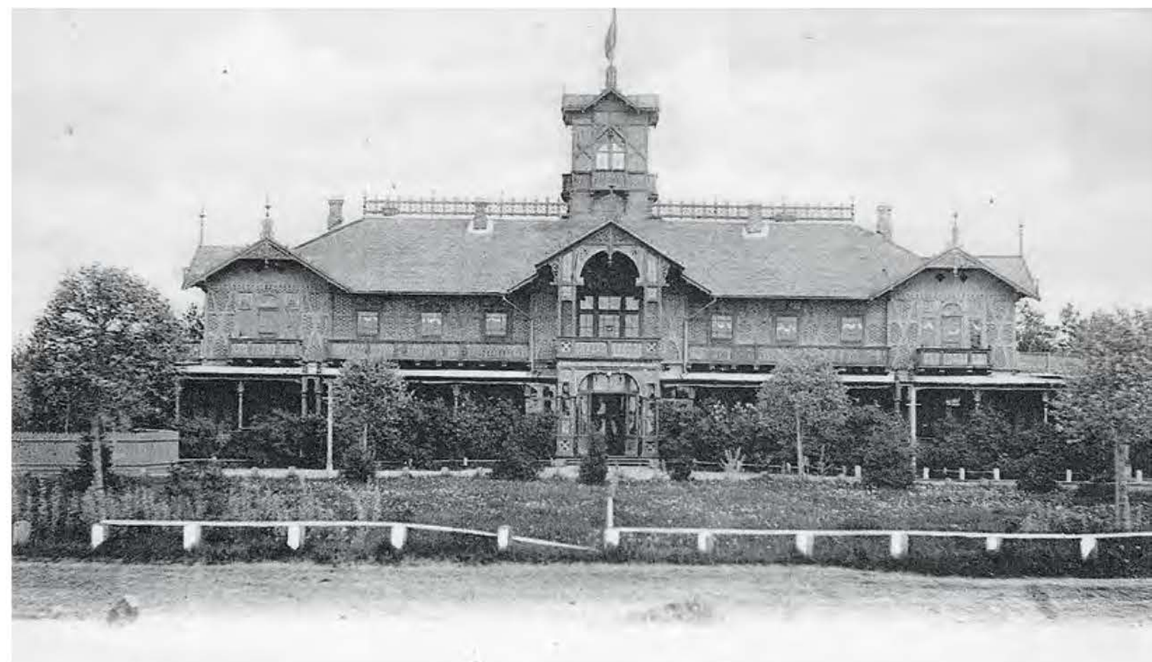
Курзал Гунгербурга. Открытка начала XX в.

В Гунгербург попадали по Балтийской железной дороге поездом до Нарвы, где была пересадка на пароход, шедший по реке Нарве до самого Гунгербурга. В Нарве обращали на себя внимание две средневековые крепости-замки, одна против другой, которые разделяла река. На левом берегу, в Нарве, стоял шведский замок с высокой башней Германа, и на правом берегу, гораздо большая по площади, крепость Ивангород с массивными, как бы вросшими в землю башнями, построенными Иваном III, и длинной крепостной стеной. Вверх по течению, на расстоянии 2–3 километров, располагался после поворота реки Нарвский водопад, разделенный островом на два рукава. На острове помещались красные кирпичные здания Кренгольмской мануфактуры, тогда — крупнейшего предприятия Эстонии. Нас, ребят, возили в ожидании парохода смотреть водопад. Падение воды — 4–5 метров. Незабываемое зрелище, на которое можно было смотреть часами. Ширина реки у основного русла была около 100 метров, у другого русла немного меньше. Шум водопада был невероятный. Теперь, в связи с постройкой Нарвской гидроэлектростанции, устройством