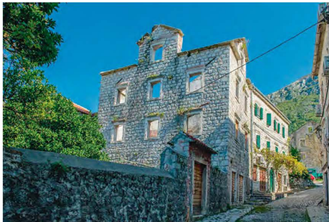
Дворец Ивеличей в Рисане