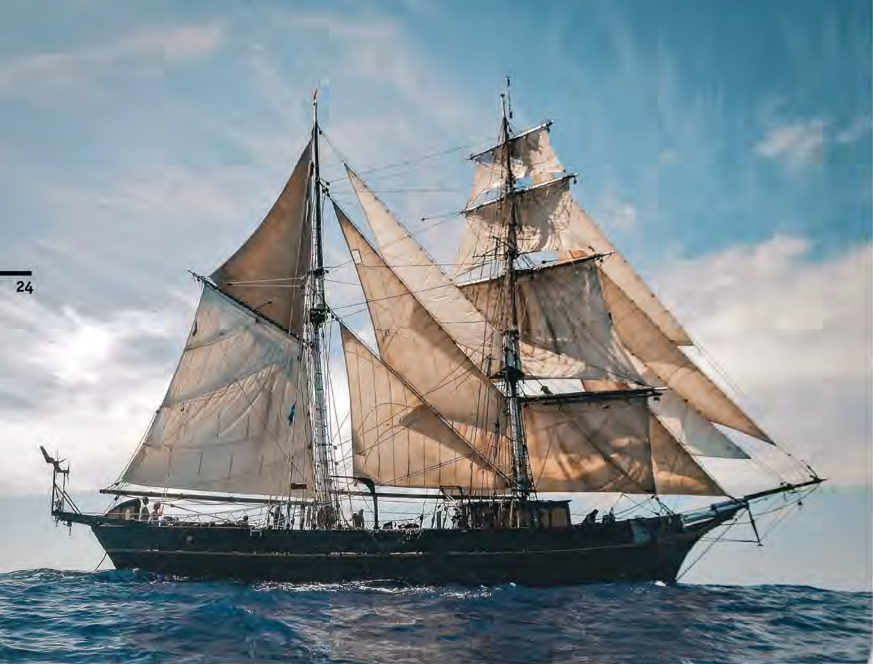
«Трес Омбрес» в море. На корме видны ветрогенераторы