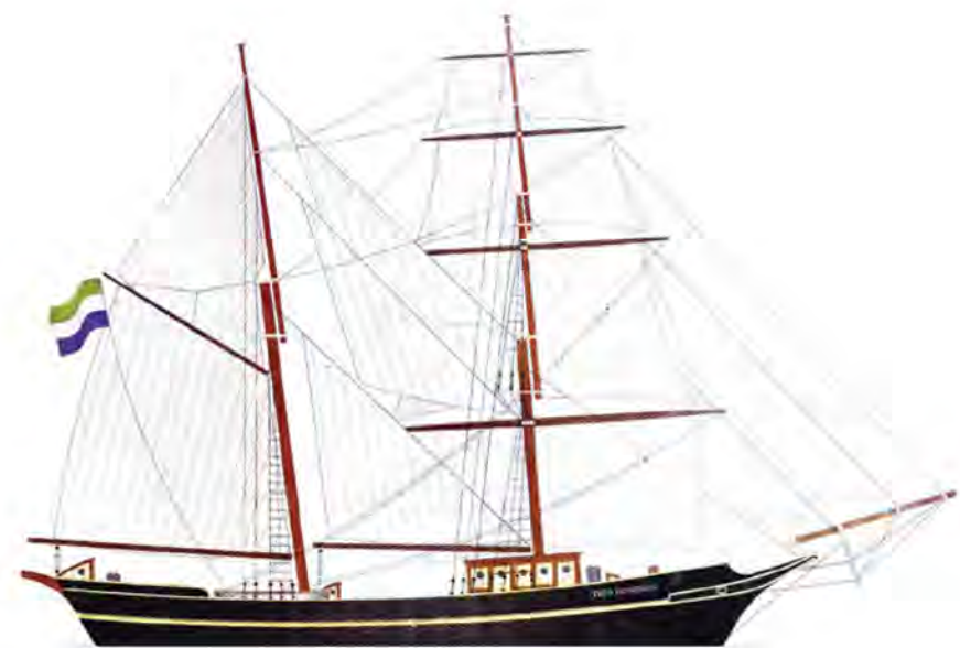
Чертежи парусника, представленные на фести- вале в Бресте, 2012 г.