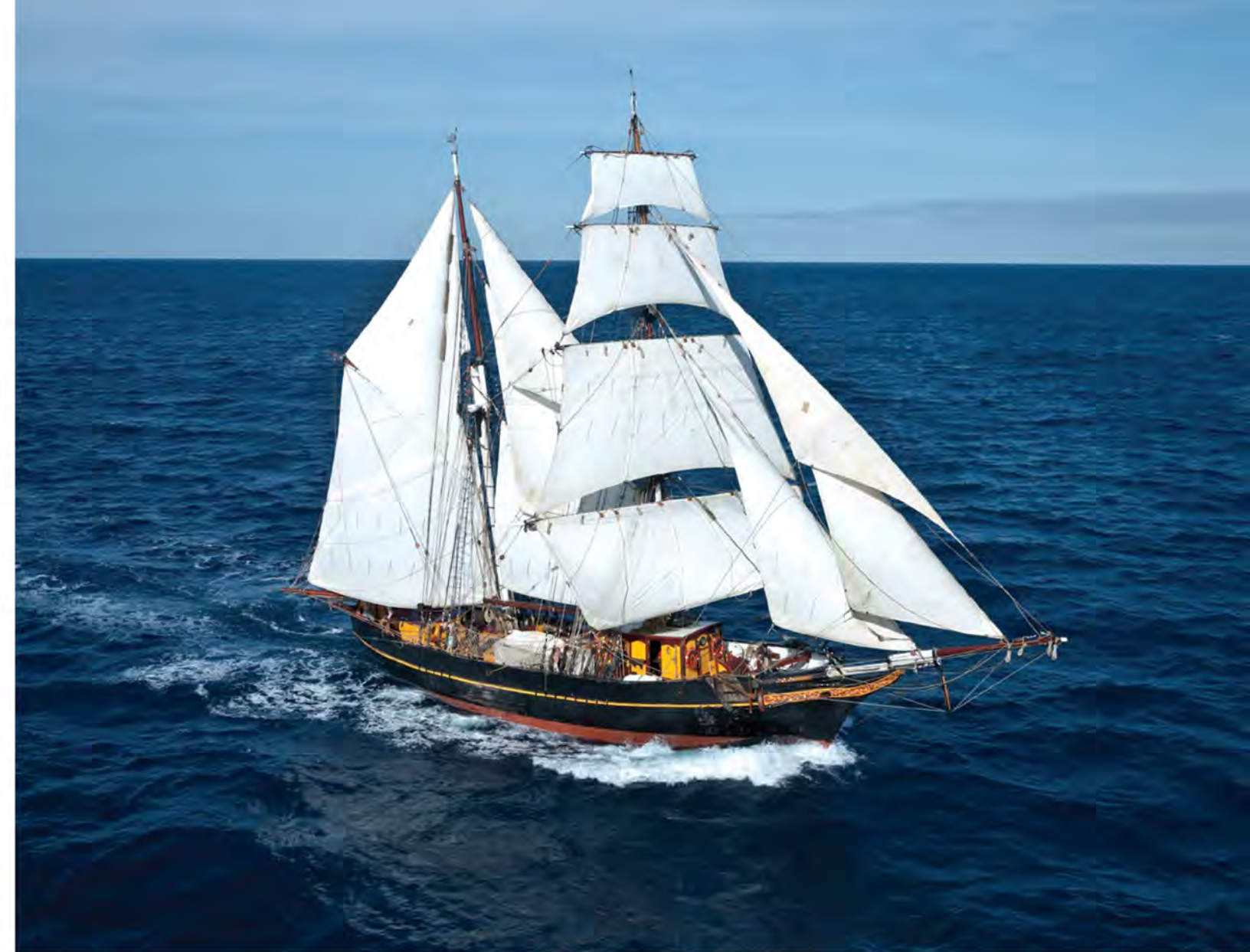
Бригантину «Трес Омбрес»

привлекло всеобщее внимание и широко освещалось в медиапространстве.