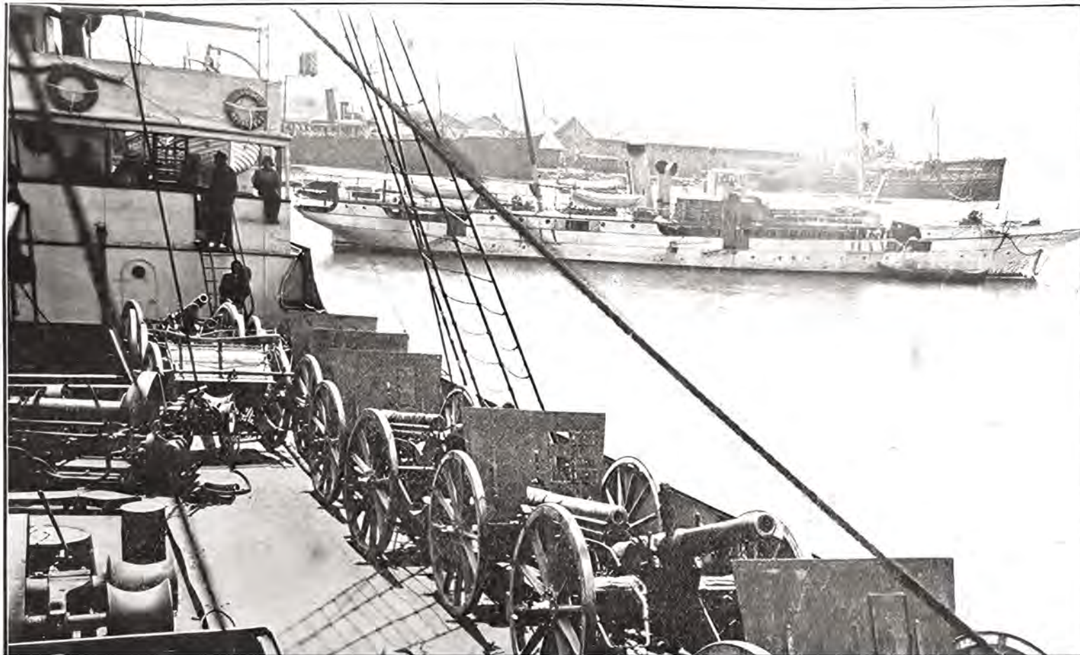
Белое судно на заднем плане — яхта «Ассос» («Тамара») в порту Пирей, 1913 г.

охотился на них по всему судну. Он мог в ярости уволить весь экипаж или выбросить весь запас угля за борт, боясь, что в бункерах спрятан динамит. Известно, что он получал детское удовольствие, обливая свою команду водой и устраивая розыгрыши, когда было подходящее настроение. Такой уж был человек.