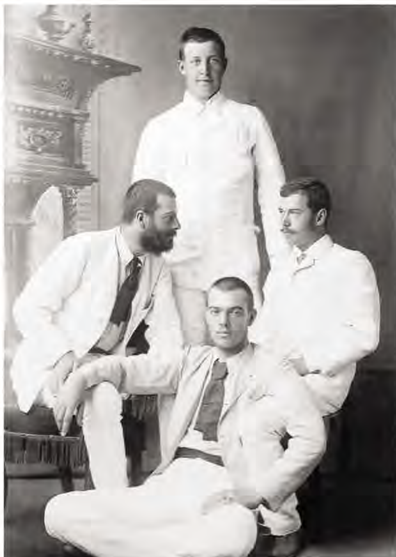
Цесаревич, великий князь Николай Александрович, великие князья Александр и Сергей Михайловичи, принц Георг Греческий в Коломбо (Цейлон), 1891 г.

свободно, не будучи связан расписанием паровых рейсов. Но ввиду того, что я собираюсь отправиться в путешествие уже следующей весной, я не имею времени заказать себе яхту.