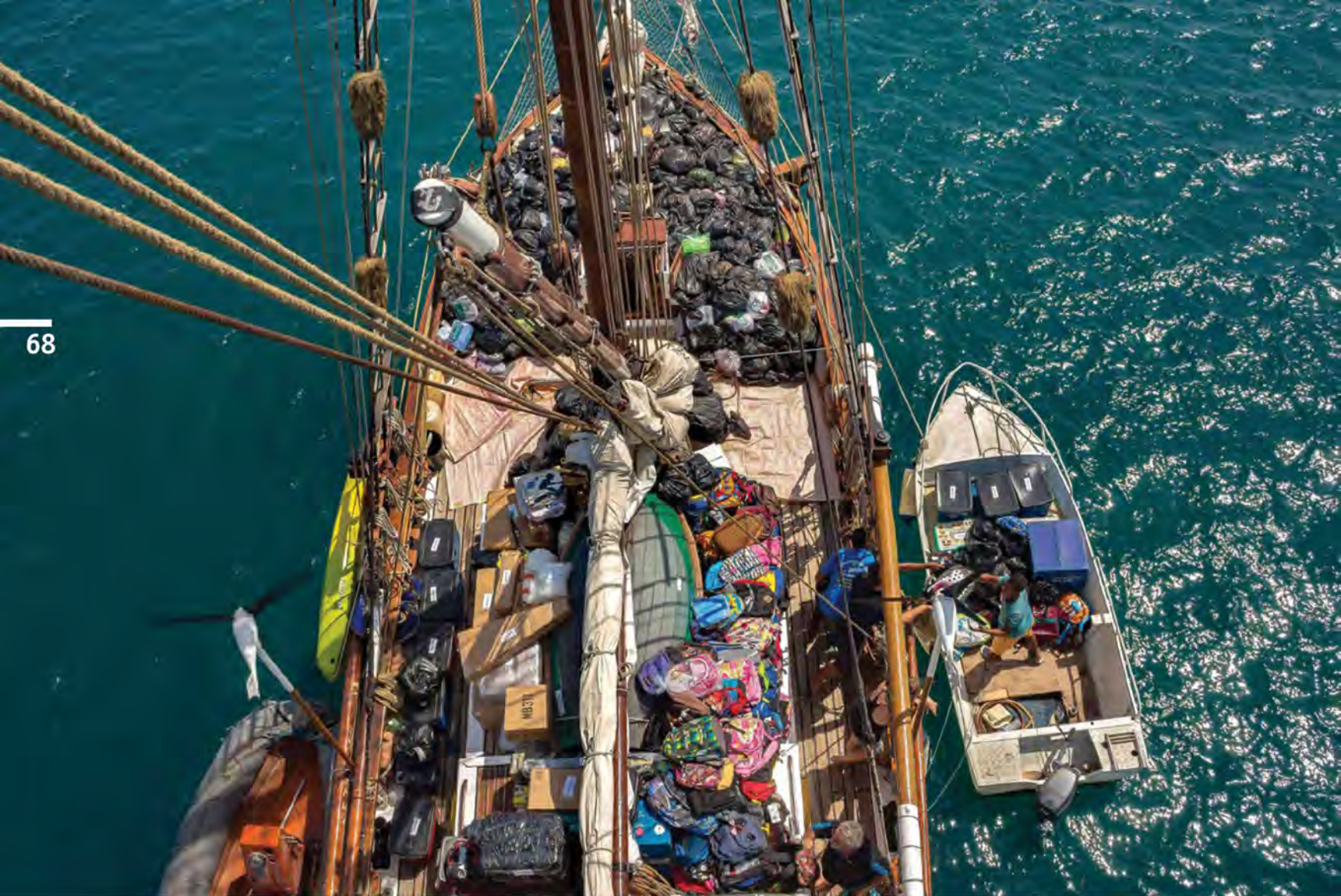
Так выглядит разгрузка «Веги» на рейде одного из удаленных островов

Но оно было не слишком долгим и закончилось на Канарских о-вах, где яхта была поднята на берег и простояла там заброшенной до 2001 г. Осуществить мечту не удалось.