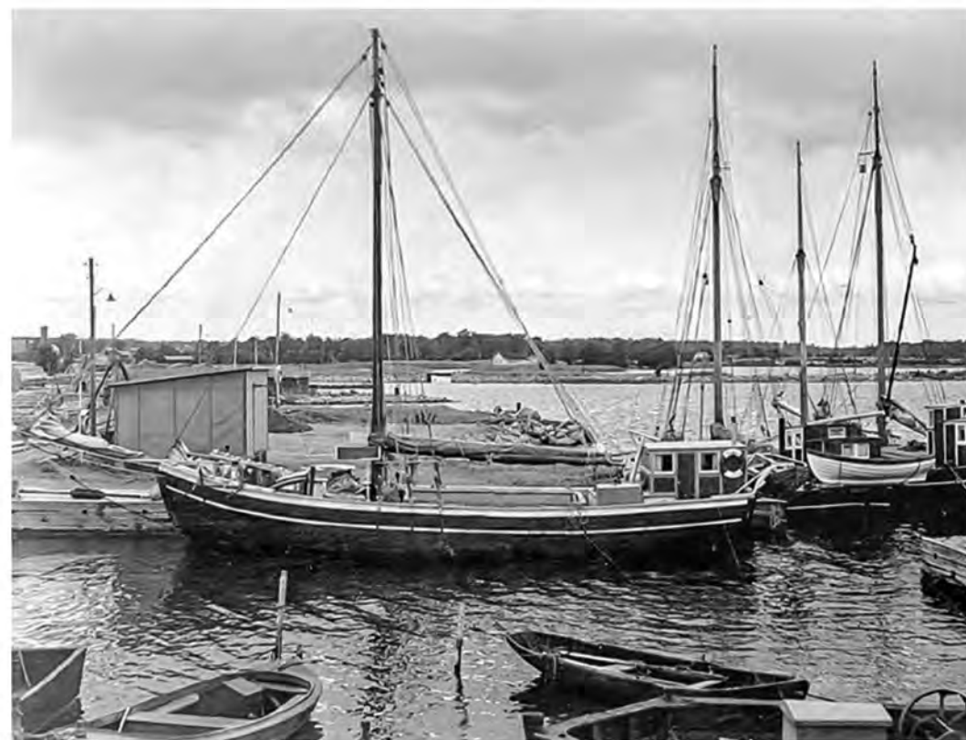
«Вега» у причала Дегерхамна, 1952 г.

поддержания связи со штаб-квартирой в Швеции. Задуманное должно было чем-то напоминать современные реалити-шоу. Дети со всего мира могли получить доступ к видео и отслеживать ход путешествия ежедневно.