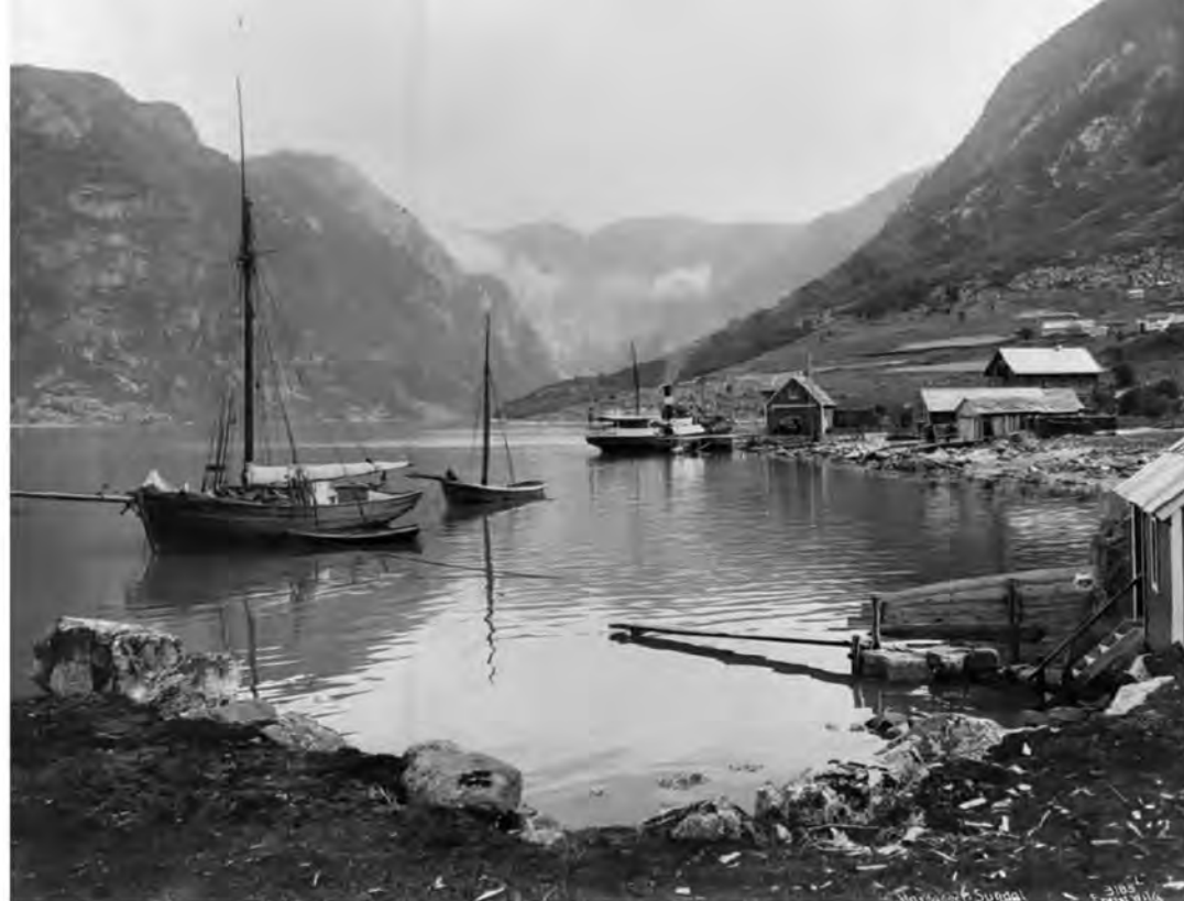
Верфь в Хардангер-фьорде, где родилась «Вега»